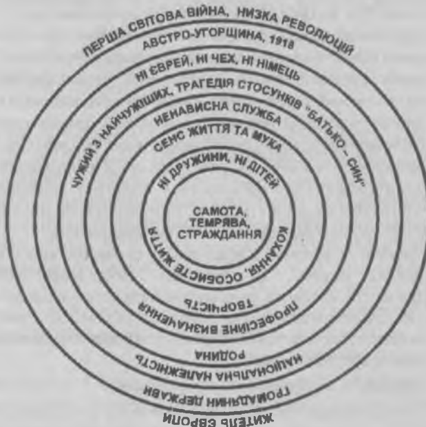
Схема № 2

Це були роки Першої світової війни, низки кривавих революцій, час, коли загинуло багато людей, коли життя людини було знецінено. На підставі цього можна вважати, що об'єктивним чинником формування такого безвідрадного світосприйняття письменника є відчуття себе жителем світу, який руйнується та гине на очах.