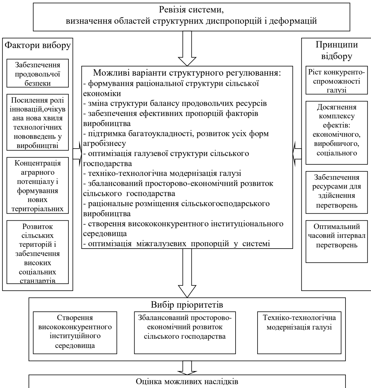
Рис. 3 - Вибір пріоритетів структурних перетворень у аграрному секторі

Принципи дозволяють сформулювати правила вибору, фактори, будучи рушійною силою змін, дозволяють віддати перевагу тому чи іншому заходу структурного регулювання. Визначаючи склад принципів, виходили з того, що заходи структурного регулювання повинні бути забезпечені ресурсами, сприяти росту конкурентоспроможності сільського господарства, мати комплекс ефектів, стимулювати ріст активності серед суб'єктів аграрного підприємництва, а часовий інтервал не повинен бути занадто великий. Фактори вибору багато в чому формуються під впливом економічних викликів і сьогодні вони пов'язані з забезпеченням продовольчої безпеки, посиленням ролі інновацій і технологічних змін у сільськогосподарському виробництві, концентрацією аграрного потенціалу і формуванням нових територіальних