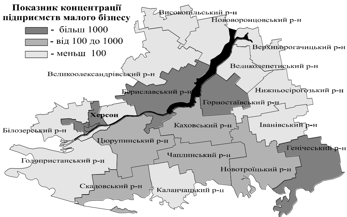
Рис. 6.1. Розподіл малих підприємств по районах Херсонської області.

орієнтації державної політики відносно малого підприємництва з метою вирівнювання його розвитку в територіальному розрізі.