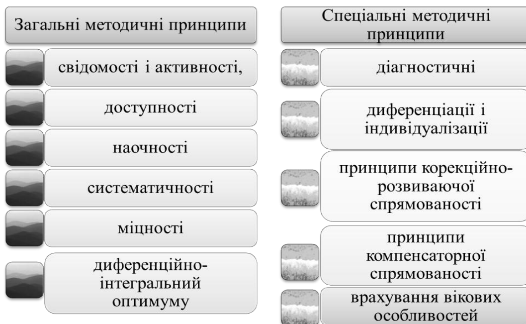
Рис. 3. Методичні принципи, на яких ґрунтується процес адаптивного фізичного виховання.

У роботі з дітьми з особливими освітніми потребами, що мають стійкі порушення у розвитку, корекційна функція виявляється у всіх напрямках адаптивної фізичної культури [2]. Процес адаптивного фізичного виховання з цими дітьми ґрунтується на загальних методичних та спеціальних методичних принципах (рис.3)