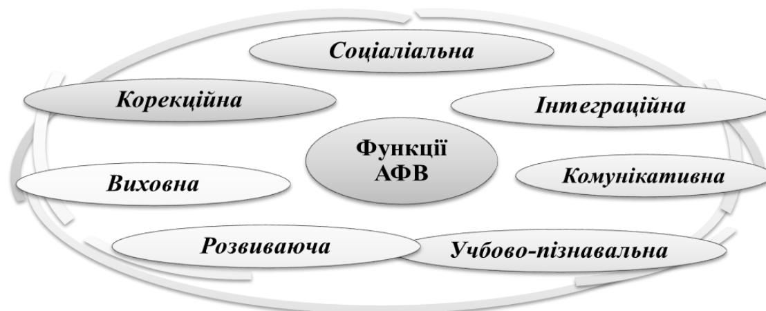
Рис. 2 Функції адаптивного фізичного виховання

Пошук шляхів вдосконалення адаптивної фізичної культури дітей з особливими освітніми потребами у багатьох науковців завжди викликав великий інтерес. Найбільш значущими на сьогодні є, такими, що висвітлюють шляхи ефективної реалізації основних функцій АФВ (рис. 2).