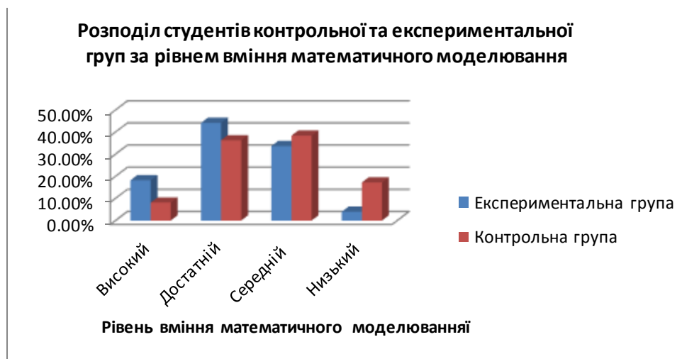
Рис.3. Розподіл студентів контрольної та експериментальної груп за рівнем вмінь математичного моделювання

Надалі, у КГ навчання відбувалось за традиційною методикою, а в ЕГ – за авторською методикою навчання ТЙ та ВП. Результати проведення другого контрольного зрізу показали, що рівні розвитку вмінь математичного моделювання в студентів технічних спеціальностей мають певні розбіжності в експериментальних і контрольних групах. Результати проведеної роботи зображено на рис. 3.