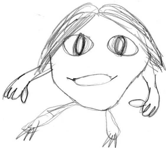
Рис. 2. Малюнок дівчини

За результатами дослідження, проведеного в одній з міських шкіл, можна зробити висновок, що лише 17% (2 осіб) дівчаток мають високий рівень тривожності у першому класі. На першому малюнку ми звернули увагу на очі неіснуючої тварини, саме вони вказують на рівень страху та тривожності, який людина не усвідомлює: райдужки очей промальовано не з першого разу, сильний натиск на олівець (див рис. 2) . На другому малюнку багато жирних ліній, промальованих двічі, бачимо сильний натиск на олівець при малюванні контуру.