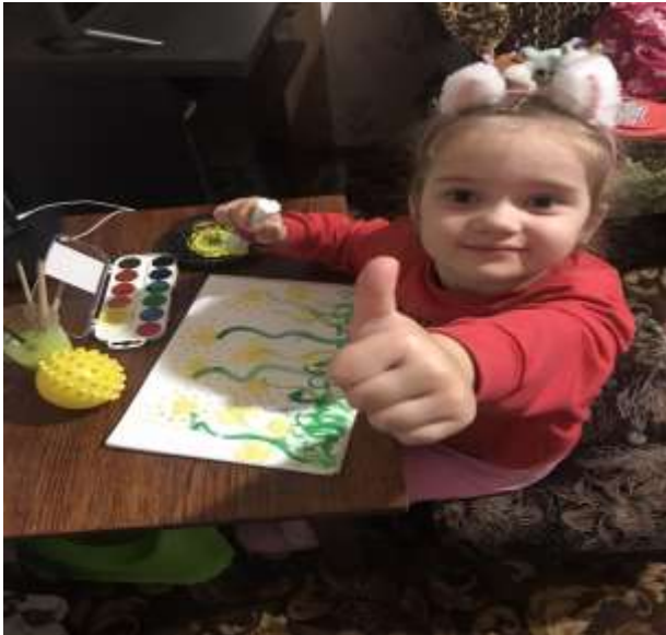
Фото-звіт малювання ватними паличками і дудлінг-зінтангл на педагогічному факультеті