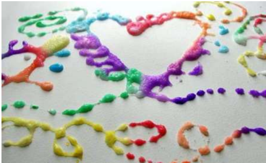
Рис. 2.2. Ефект від малювання об'ємною фарбою

Такий спосіб малювання підходить для малювання з дітьми, починаючи з півторарічного віку.