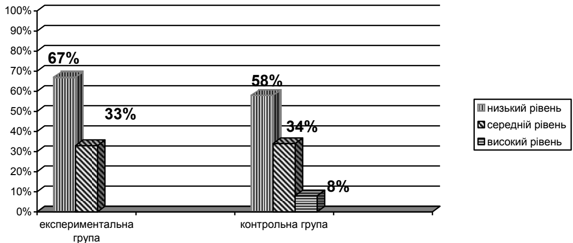
Рисунок 2.1. Моніторинг рівня художньо-естетичного виховання дітей старшого дошкільного віку експериментальної і контрольної груп під час констатувального експерименту

звуків, які можуть бути сприйняті як зразки прекрасного. Однак тільки наявність цих об'єктів ще недостатньо для виникнення у дітей естетичних почуттів і художнього смаку, дитина повинна навчитися сприймати різноманітні форми, гармонію звуків, фарб і відчувати при цьому естетичні почуття. Зобразимо результати констатувального етапу графічно (рис.2.1.).