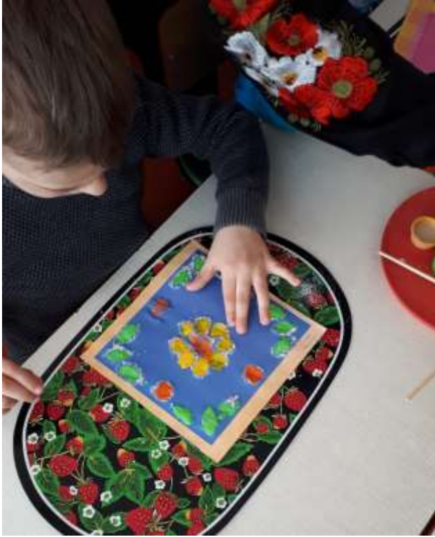
Фото-звіт заняття малювання сіллю