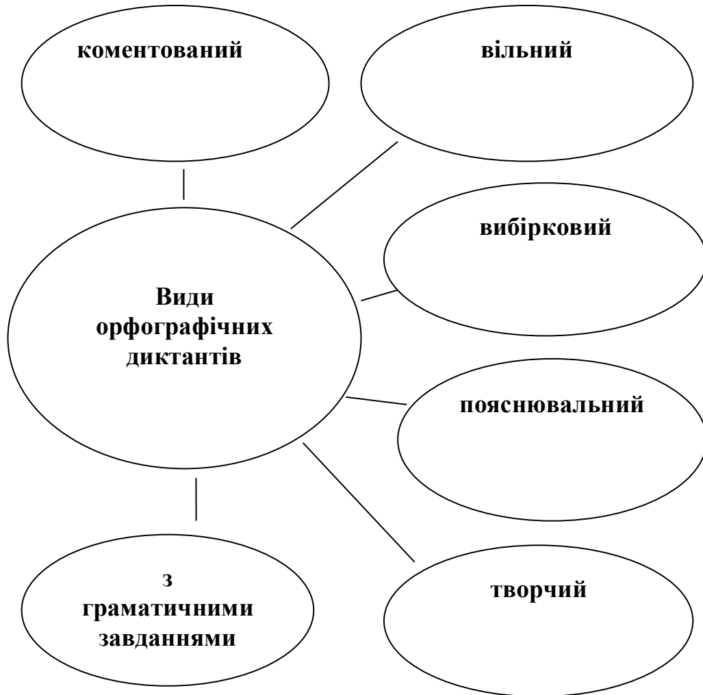
Рис. 2.1 Види диктантів

В методиці навчання орфографії існує декілька видів диктантів. Представимо це узагальнено на рис. 2.1.