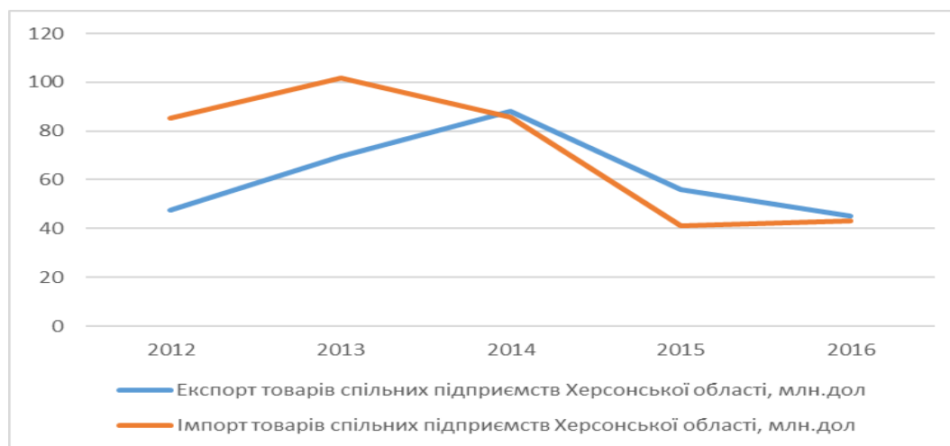
Рис. 7.1. Участь спільного підприємництва у зовнішній торгівлі Херсонської області

Так результати дослідження участі спільного підприємництва у зовнішній торгівлі Херсонщини, відображені на рис. 7.1, показали, що частка їх зовнішньоторговельного обороту на початок 2017 р склала 18,8% загального обсягу зовнішньої торгівлі області в цілому і збільшилася в порівнянні з рівнем попереднього року на 1%.