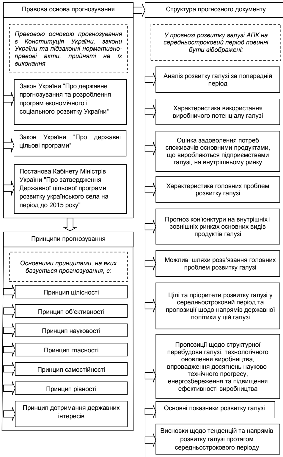
Рис.1. Прогнозування в галузі агропромислового виробництва *