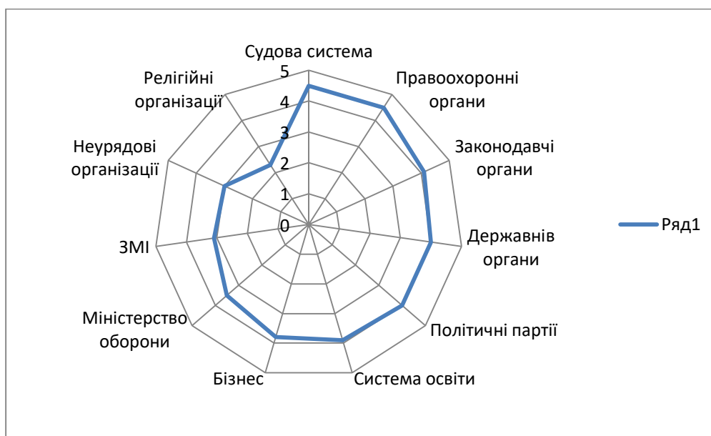
Рис.1. Рівень корупції в Україні в залежності від сфери оцінений за 5-ти бальною системою

За результатами досліджень О.В. Длугопольського та Ю.П. Івашук [30] схематично відобразити рівень корупції в Україні за сферами та рівнем його проявів можна наступним чином: