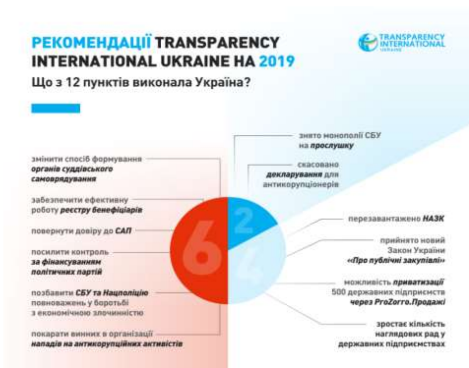
Рис.2. Співвідношення виконаних та не виконаних рекомендацій Transparency International Ukraine на 2019

За матеріалами офіційного сайту Transparency International Ukraine на 2019 у рис.2. визначено співвідношення виконаних та не виконаних рекомендацій.