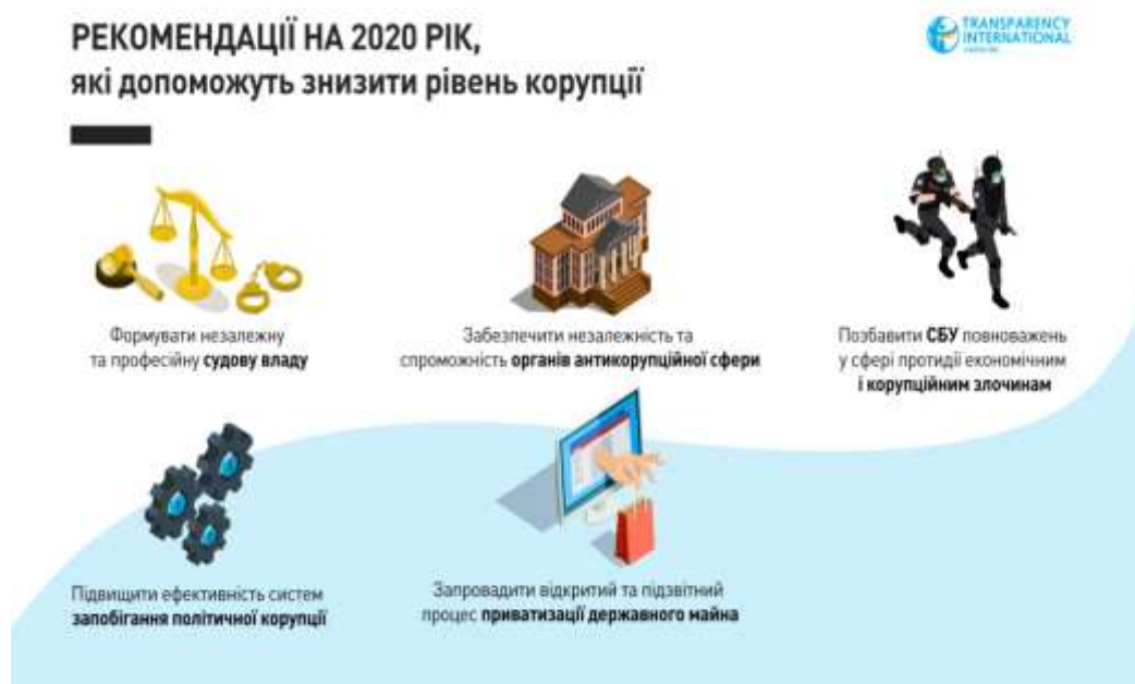
Рис.3. Рекомендації Україні на 2020 рік, які допоможуть знизити рівень корупції

Для реалізації вказаних Transparency International рекомендацій необхідно вчинити наступні дії: