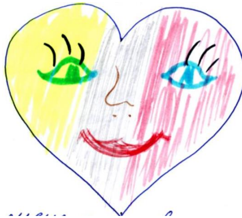
Рис. 3. Метод «письмо в малюнках» за темою: «Моє серце»