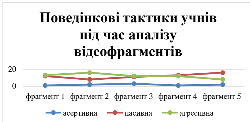
Рис.1.1. Поведінкові тактики учнів під час аналізу мультиплікаційних відеофрагментів.

якщо йдеться про захист території, власних інтересів. Частина дітей схильна до пасивної поведінки, щоб вийти з ситуації конфлікту, здатна йти на компроміс, поступитися власними інтересами, піддається впливу. І тільки незначна частина дітей спроможна обирати адекватний стиль поведінки, вміють домовлятися, цінують партнерство. Розподіл поведінкових тактик наведено на рис.1.1.: