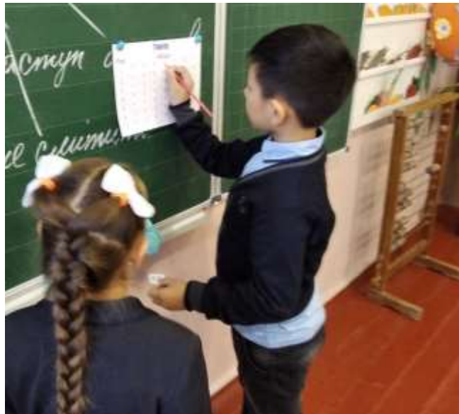
Рис. 2.1. – Фрагмент гри «Добери пару»