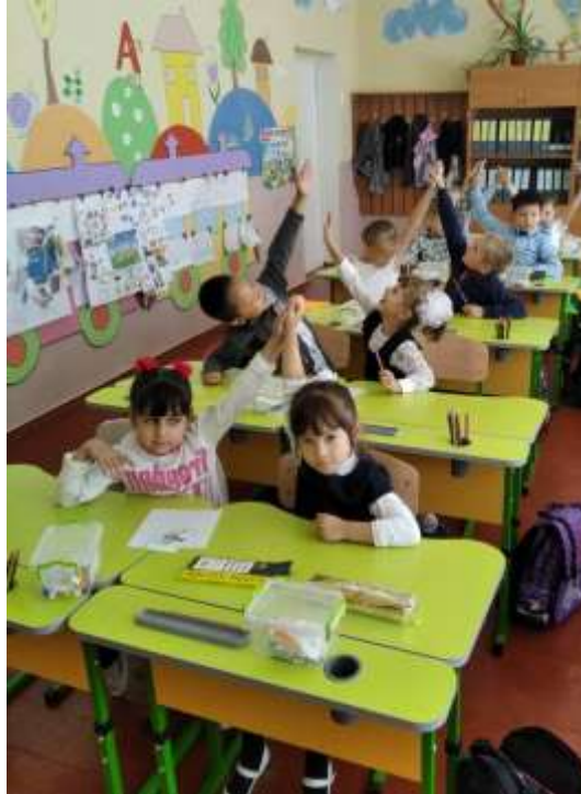
Рис.2.2. –Фрагмент гри «Числовий ряд»

обмінюються картками, утворюючи таким чином правильний числовий ряд. Попередньої вчитель повідомляє напрямок числового ряду. Перемогу одержує та команда, гравці якої правильно та найшвидше склали заданий числовий ряд.