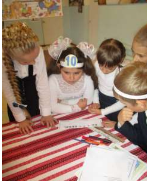
Рис. 2.5. – Фрагмент гри «Найкмітливіший»

мислення, творчу уяву, пізнавальний інтерес, пам'ять, спостережливість, мову, швидкість реакції; виховувати почуття дружби, взаємодопомоги.