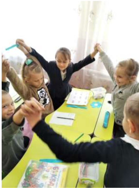
Рис. 2.4. – Фрагмент гри «У кого більше доказів?»

Під час позакласної роботи нами було проведено: