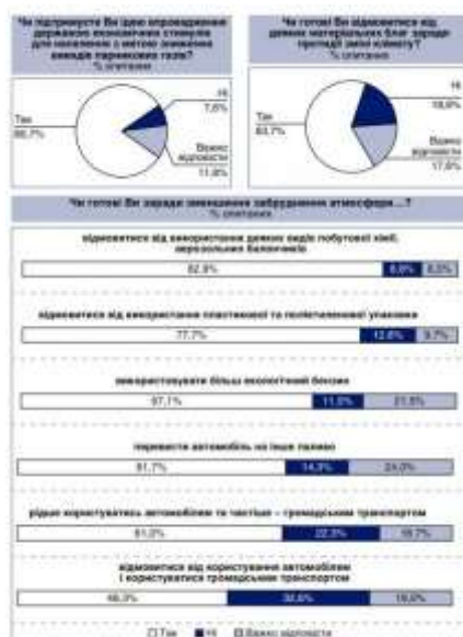
Рис. 2. Відповіді на питання «Чи готові ви відмовитися від деяких матеріальних благ заради протидії зміні клімату?»

Така готовність має конкретну предметність: 82,9% опитаних готові відмовитися від деяких видів побутової хімії, аерозольних балончиків, 77,7% - від пластикової та поліетиленової упаковки, 67,1% - готові використовувати більш екологічний бензин, 61,7% - перевести автомобіль на інше паливо, 61,0% - рідше користуватися автомобілем, та частіше – громадським транспортом, 48,3% - готові навіть відмовитися від користування автомобілем і користуватися громадським транспортом. Такі дані про стан громадської думки є свідченням того, що у населення склався певний стереотип самообмеження масової екологічної свідомості. Стереотип свідомості – спрощений образ-уявлення щодо змін клімату і можливої протидії їм. Це феномен як масової свідомості, так і диспозиція індивідуальної свідомості. Особливість таких стереотипів – їх ригідність, стійкість. Даний конкретний стереотип – позитивний, адекватний загрози зміні клімату. Стереотипи бувають як неадекватні, негативні, шкідливі, які є пережитками, так і позитивними, адекватними, корисними. Стереотипи-пережитки необхідно долати, ламати, а стереотипи адекватні – використовувати для розвитку, користуватися їх когнітивною економністю, емоційною стійкістю і соціальною динамічністю. Суспільство зацікавлене в тому, щоб стереотипи екологічної свідомості трансформувалися у стереотипи поведінки, екологічно