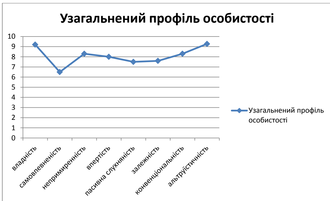
Рис. 1. – Узагальнений профіль особистості за тестом Т,Лірі.

Середні показники за тестом Т,Лірі виглядають наступним чином.