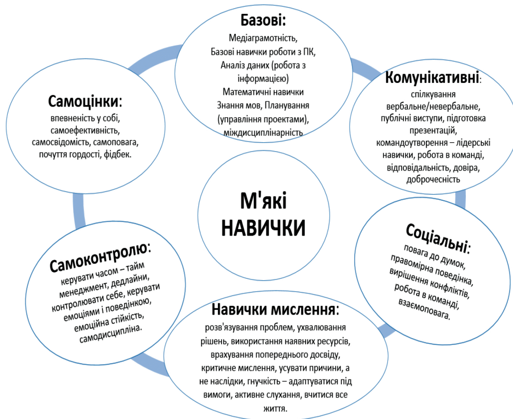
Рис. 1. Структура soft skills як база для формування у здобувачів передвищої освіти

Комунікативні навички. Це одна з найперших вимог, яка необхідна для ефектив-