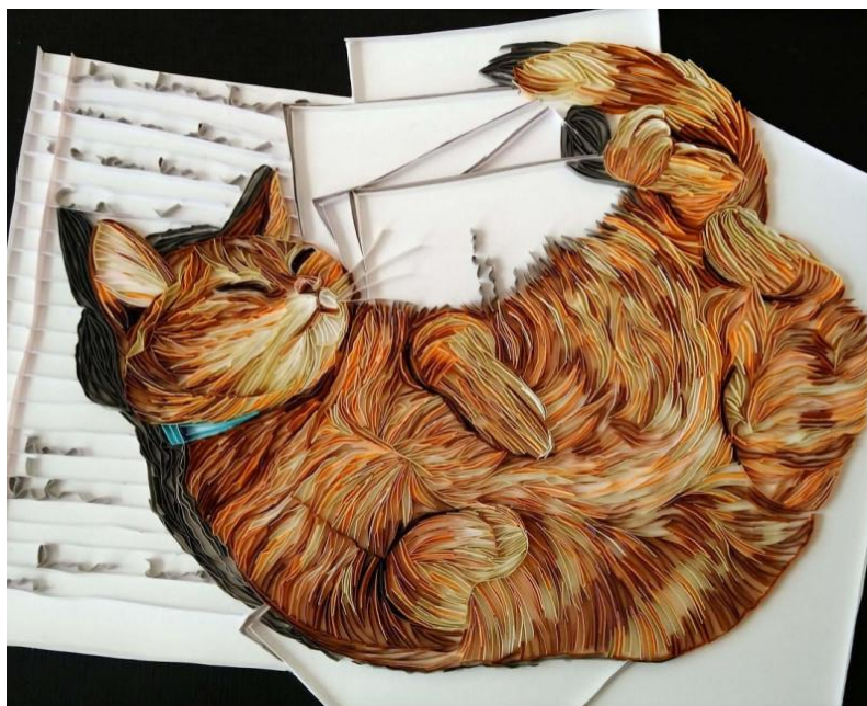
Мал.1 Стоунфокс Б. Кошеня

Приголомшливі твори мистецтва, створені в техніці «квіллінгу» британською художницею Бекою Стоунфокс