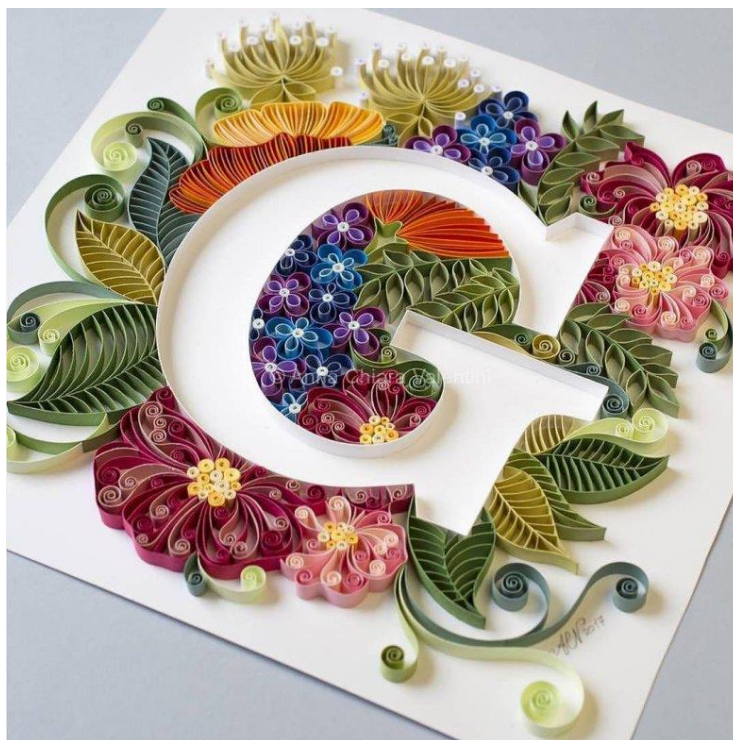
Мал.2. Буква з паперу