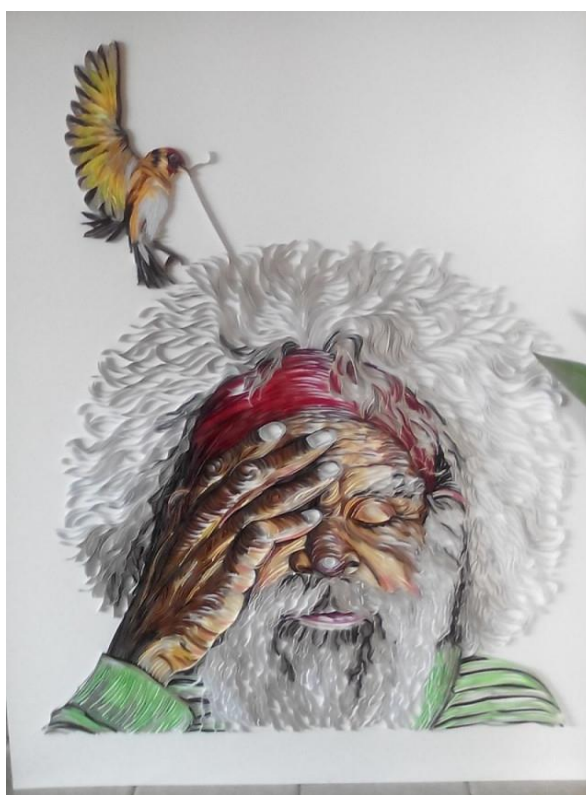
Мал.2 Стоунфокс Б. Чоловік