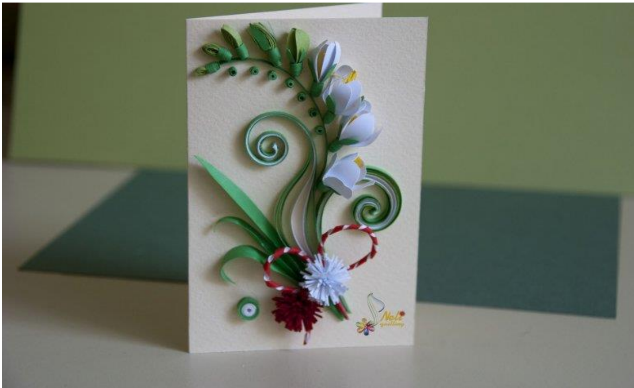
Мал.1. Листівка в техніці плетінка