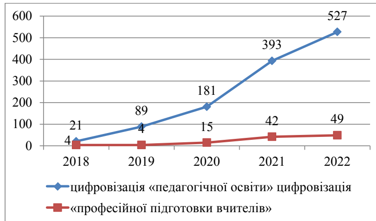
Рис. 1. Розподіл за роками наукових публікацій, відібраних засобами пошукової системи Google Scholar

Отже, протягом п'яти років (2018–2022) інтерес дослідників до проблеми цифровізації педагогічної освіти поступово зростає. Також зрозумілою є більша кількість публікацій, відібраних за пошуковим запитом «цифровізація педагогічної освіти», який охоплює за змістом і цифровізацію професійної підготовки вчителів. На жаль, пошук у Google Scholar має певні недоліки. Зокрема, доволі часто зустрічаються дублі статей, а також відсутні жодні гарантії якості відібраних публікацій. Разом із тим він дає змогу отримати уявлення про інтерес науковців до певної проблеми, а також ознайомитися (хоча і не завжди) з текстами публікацій.