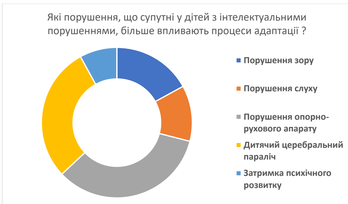
Рис. 2.2. Діаграма розподілу супутніх порушень, що впливають на процеси адаптації у дітей з інтелектуальними порушеннями.

Відповідно до рис. 2.2, 34 % респондентів вважають, що дітям, які мають порушення опорно-рухового апарату адаптуватися важче. Також важче адаптуватися 29 % дітей, що мають діагноз ДЦП та 17 % дітей мають порушення зору. Проте, 12 % респондентів вважають, що до цієї категорії відносяться і діти із порушенням слуху.