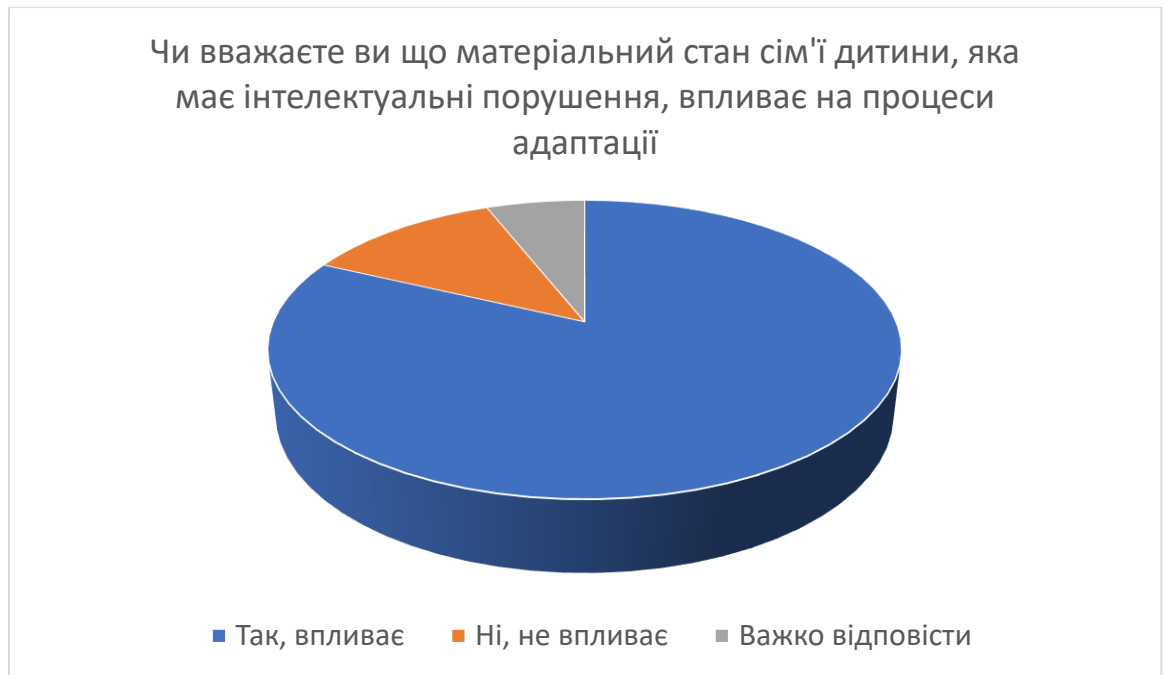
Рис. 2.6. Діаграма розподілу відповідей респондентів щодо матеріального стану сім'ї, яка виховує дитину з інтелектуальними порушеннями.

Як ми бачимо з представленої вище діаграми (рис. 2.6) при відповіді на запитання: « Чи вважаєте ви що матеріальний стан сім'ї дитини, яка має інтелектуальні порушення, впливає на процеси адаптації? », більшість респондентів відповіла, що матеріальний стан сім'ї впливає на процеси адаптації (82 %) . 12 % опитаних сказали, що важко відповісти, в той час 6 % респондентів вважають, що матеріальний стан сім'ї дитини не впливає на процеси адаптації.