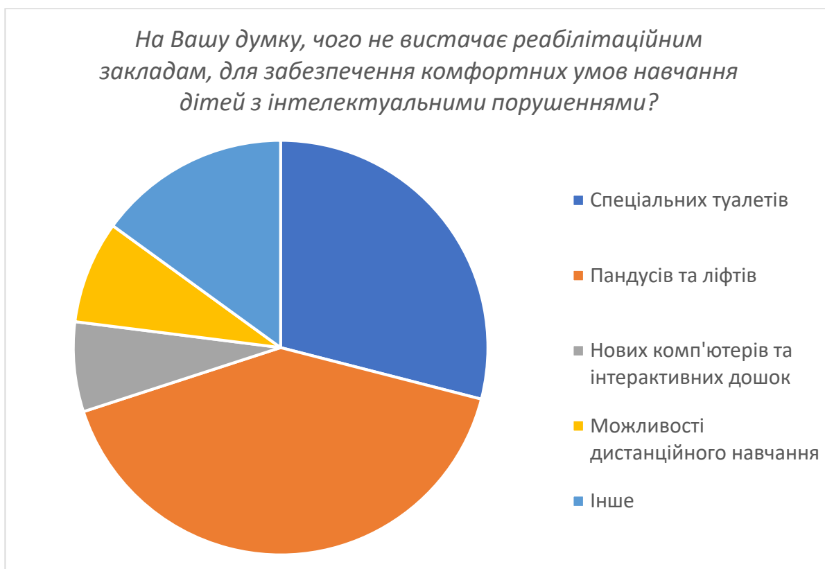
Рис. 2.5. Діаграма розподілу відповідей респондентів щодо забезпечення комфортних умов навчання дітей з інтелектуальними порушеннями в умовах реабілітаційних закладів

Далі респондентам було поставлено питання щодо забезпечення комфортних умов в реабілітаційному закладі для дітей з порушеннями розвитку.