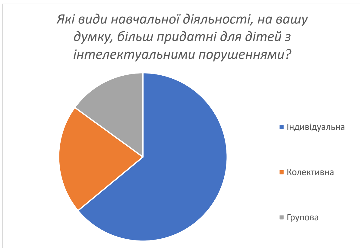
Рис. 2.6. Діаграма розподілу відповідей батьків щодо видів навчальної діяльності, які придатні для дітей з інтелектуальними порушеннями в умовах реабілітаційних закладів.

На представленій діаграмі (рис. 2.6) видно, які види навчальної діяльності є набагато ефективнішими для дітей з інтелектуальними порушеннями на думку батьків: Індивідуальна навчальна діяльність (64 %), колективна навчальна діяльність (21 %), групова навчальна діяльність (15 %).