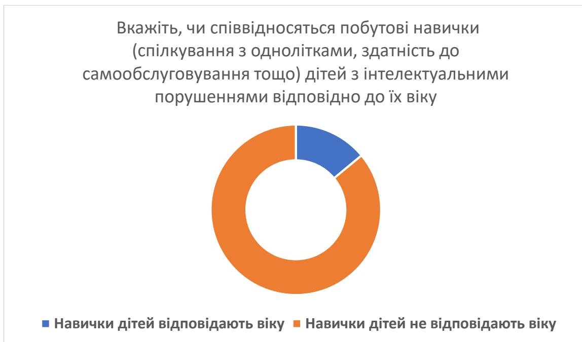
Рис. 2.1. Діаграма розподілу співвідношення побутових навичок у дітей з інтелектуальними порушеннями відповідно до вікових характеристик.

На даному рисунку (рис. 2.1) видно, що переважна частина респондентів при відповіді на запитання: «Вкажіть, чи співвідносяться побутові навички (спілкування з однолітками, здатність до самообслуговування тощо) дітей з інтелектуальними порушеннями відповідно до їх віку» відповіло, що навички дітей не відповідають віку (86 %), решта відповіла, що навички дітей відповідають віку (14 %).