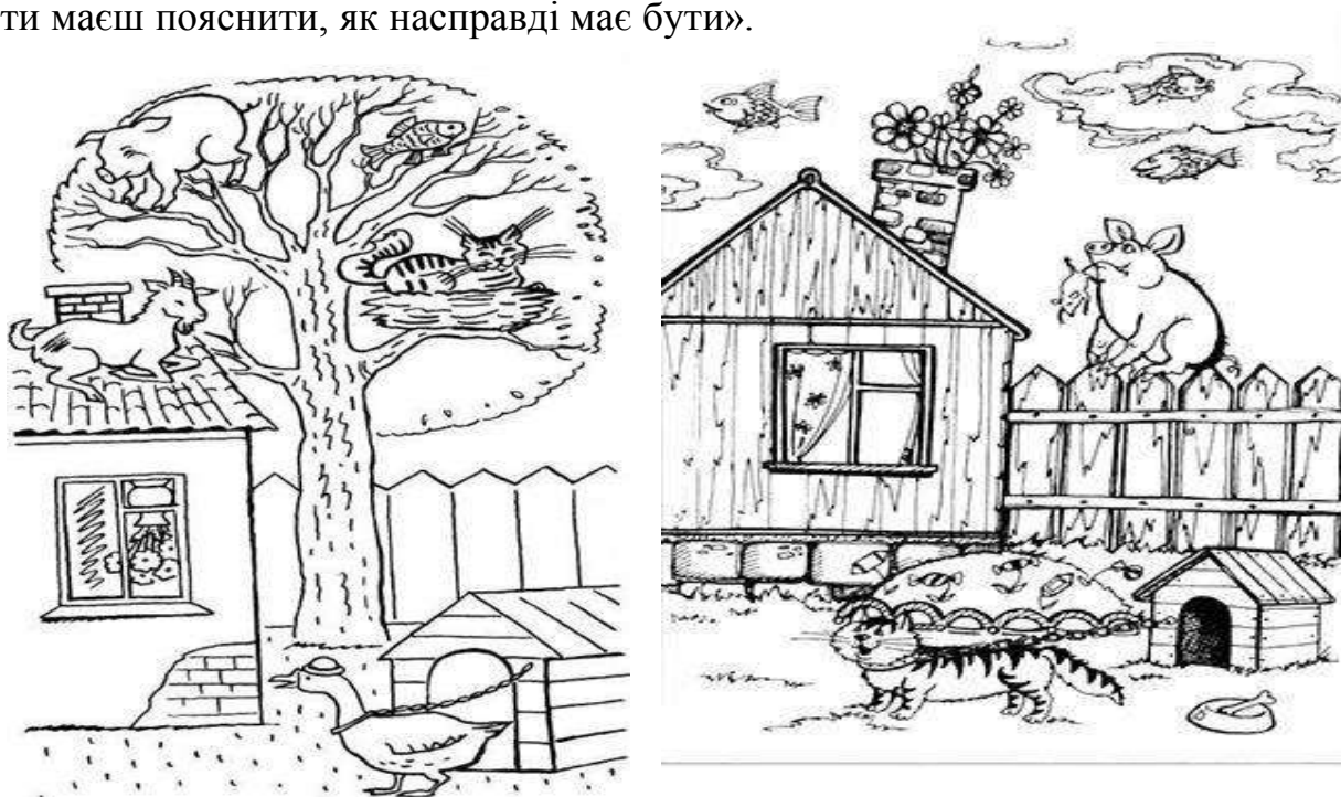
Рис. Приклади картинок до методики

Процедура проведення методики: спочатку дитині показують картинку, зображену нижче (рис.). У ній є кілька досить безглузких ситуацій з тваринами. Під час розгляду картинки дитина отримує інструкцію приблизно наступного змісту: «уважно подивися на цю картинку і розкажи, чи все тут знаходиться на своєму місці і правильно намальовано. Якщо що-небудь тобі здається не так, не на місці або неправильно намальовано, то вкажи на це і поясни, чому це не так. Далі ти маєш пояснити, як насправді має бути».