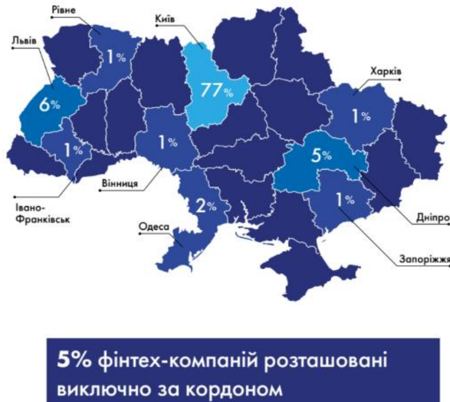
Рис.1 Розташування фінтех-компаній в Україні.

України "Про віртуальні активи" та Закон України "Про платіжні послуги". 39% опитаних компаній стверджують, що регуляторні зміни принесли нові можливості для бізнесу в умовах повномасштабного вторгнення. 12% зазначили, що умови ведення бізнесу покращилися. Більше того, 29% опитаних підприємств взагалі не зазнали впливу нових законодавчих змін.