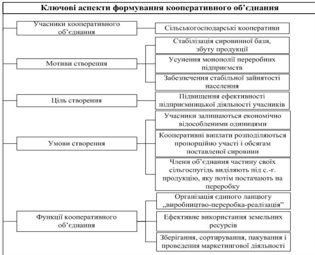
Рис. 1. Схема створення кооперативного об'єднання (союзу)