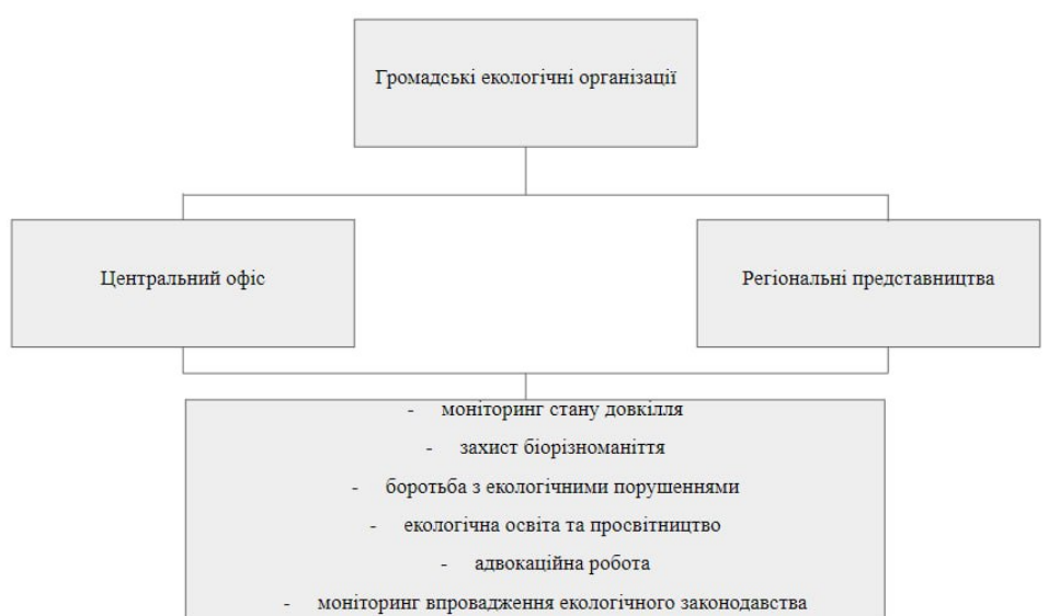
Рисунок 2.1 – Структура громадських екологічних організацій

Структура та діяльність громадських екологічних організацій (рис. 2.1) в Україні відзначається своєю різноманітністю та динамізмом, відображаючи широкий спектр екологічних інтересів та потреб суспільства.