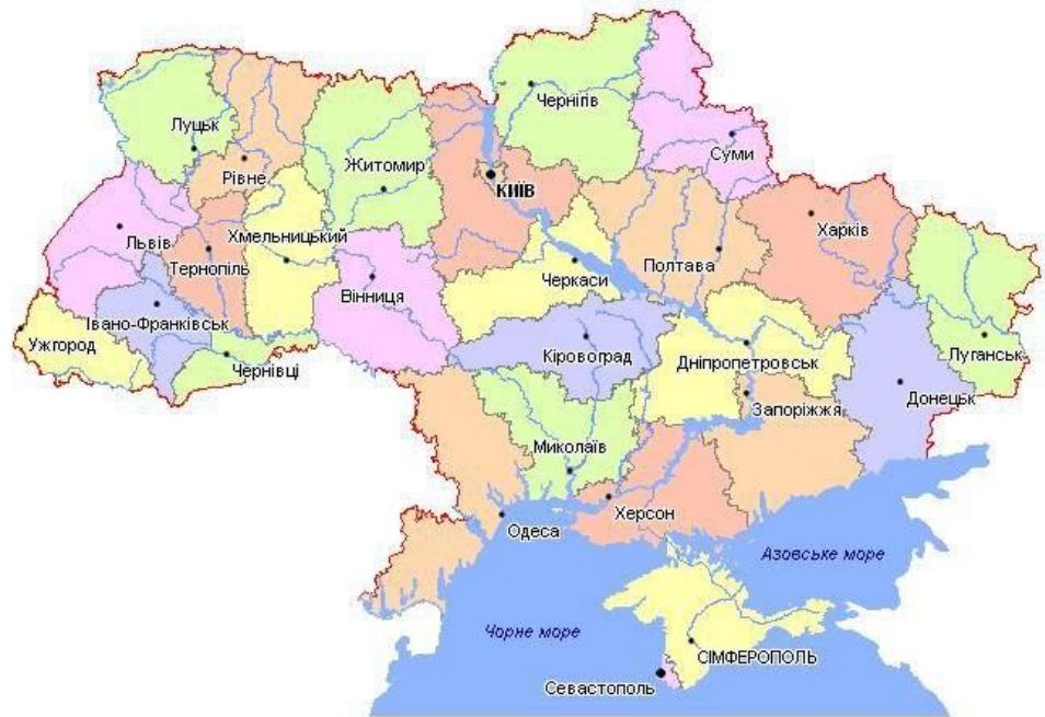
Рисунок 3.3 - Карта України по областях [8].

Завдання. Скласти маршрут для пізнавального, спортивного, рекреаційного або екологічного туризму у будь-якій місцевості України.