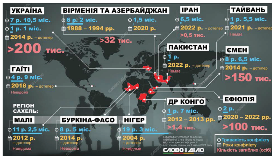
Рис. 2. Збройні та політичні конфлікти у 2023 році (за версією Міжнародної кризової групи)