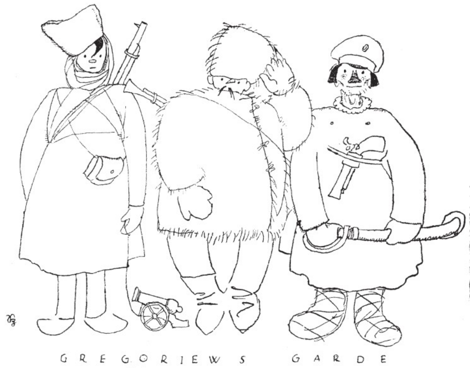
Рисунок 3.2 – «Гвардія Григор'єва» карикатура К. Зафранскі [10]