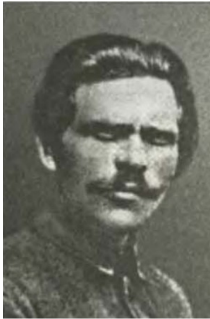
Рисунок 2.5 – Нестор Махно, фото зроблено вже в еміграції [12]