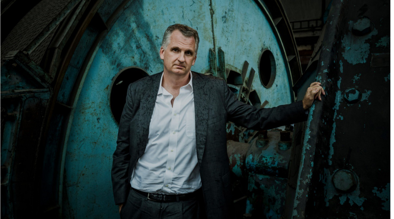
Рисунок 1.1 – Тімоті Снайдер на прев'ю відео курсу лекцій «The Making of Modern Ukraine» для Єльського університету [39]

На рисунку 1.1 зображено американського історика та письменника, професора Єльського університету – Тімоті Снайдера.