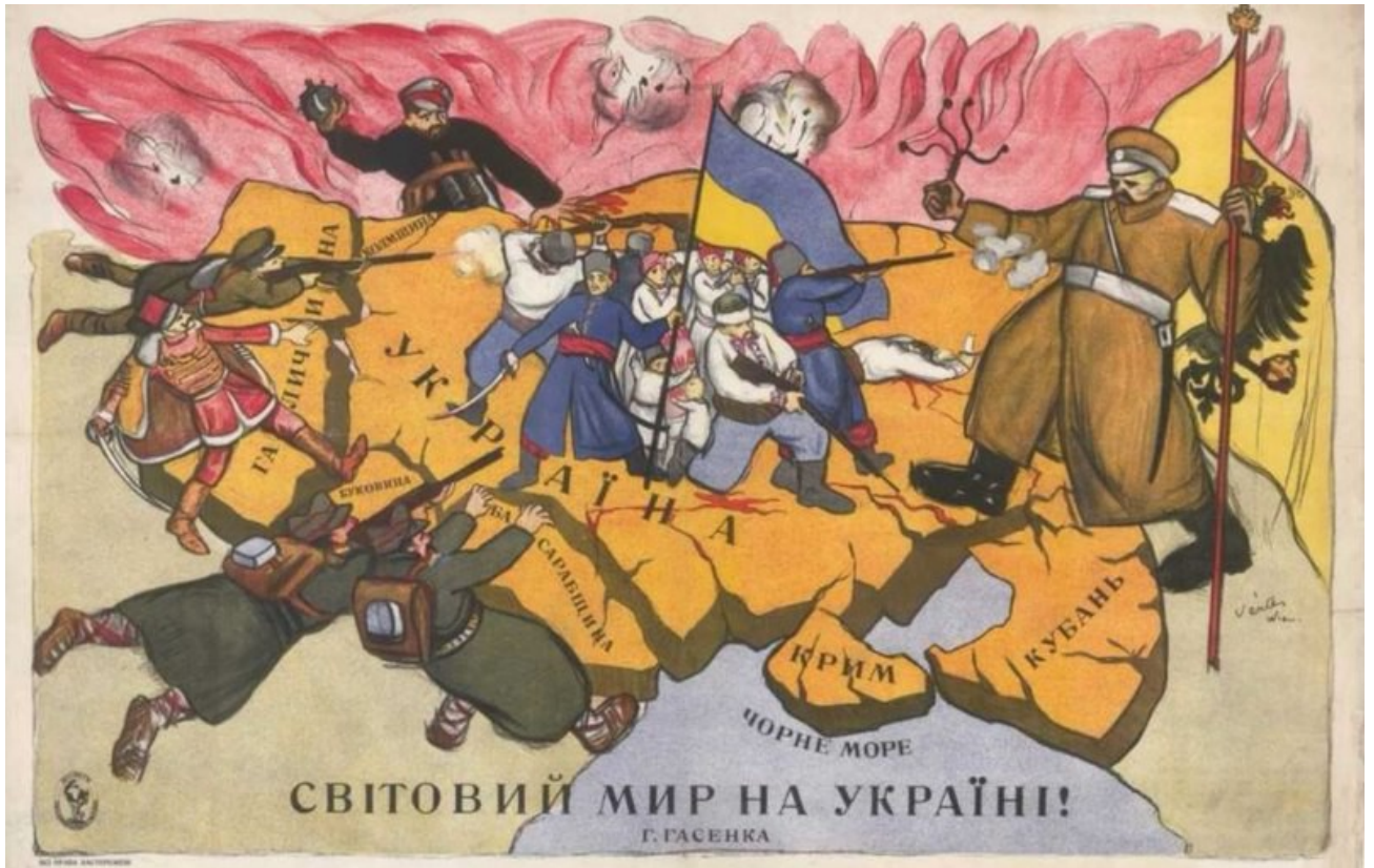
Рисунок 3.1 – «Світовий мир на Україні», авторства Г. Гасенка

Карикатура «Світовий мир на Україні», опублікована у 1919 році у Відні, видавництвом під назвою «Christoph Reisser's Söhne», зображена на рисунку 3.1.