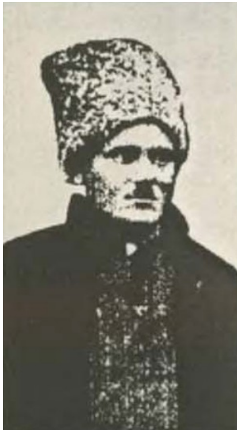
Рисунок 2.1 – Отаман Н. Григор'єв [12]

На рисунку 2.1 зображено отамана Григор'єва Никифора Олександровича.