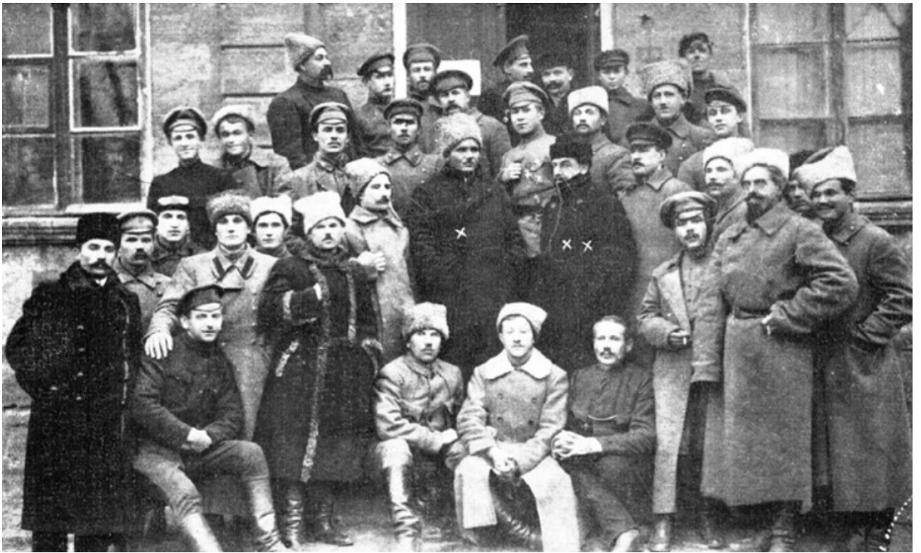
Рисунок 2.2 – Отаман Григор'єв і його штаб в Миколаєві [10]

На рисунку 2.3 зображено листівки, що поширювались Миколаєвом після взяття міста григор'євцями у грудні 1918 року, із закликами до відновлення влади УНР.