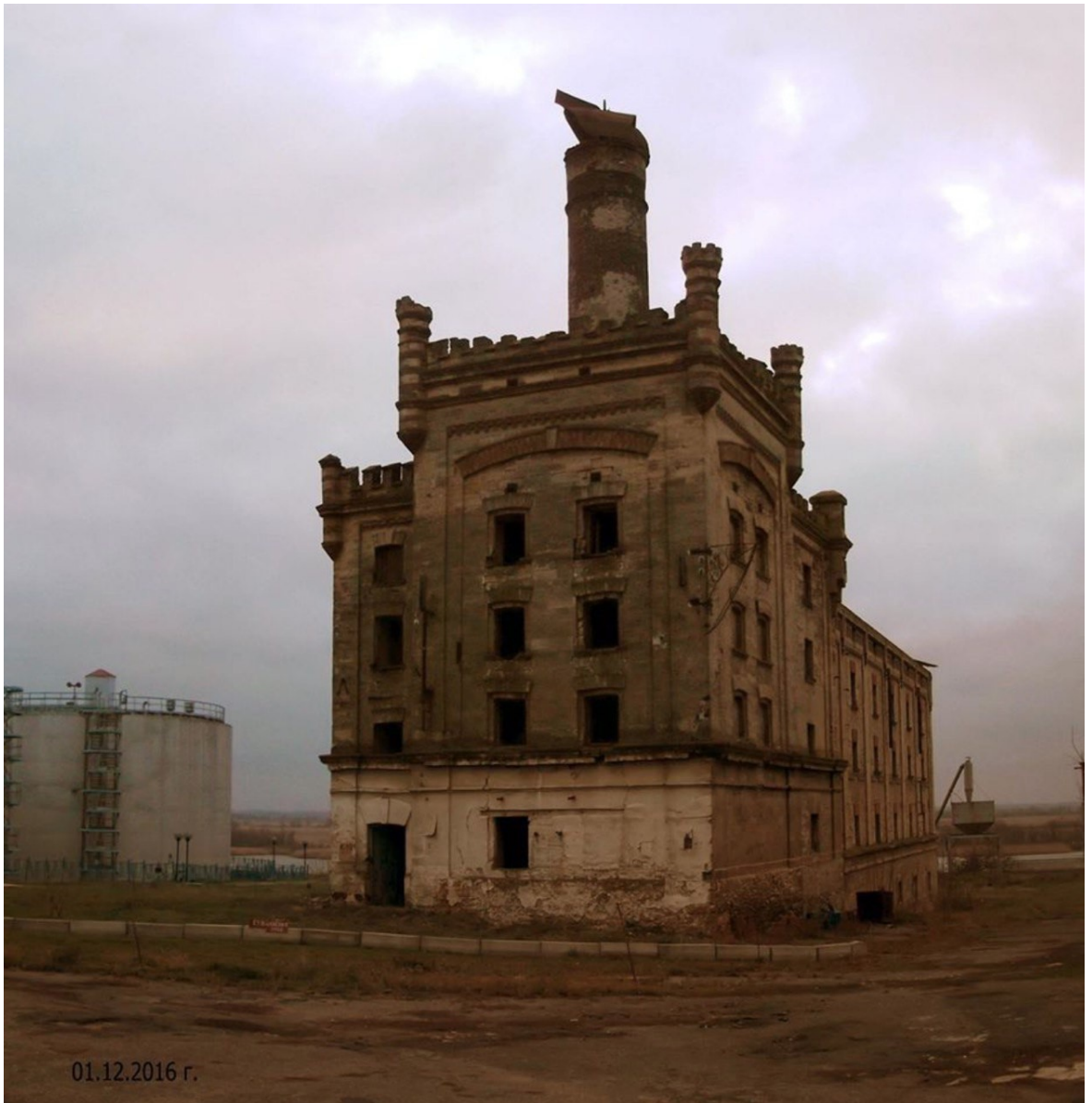
Фото херсонського пивзавода