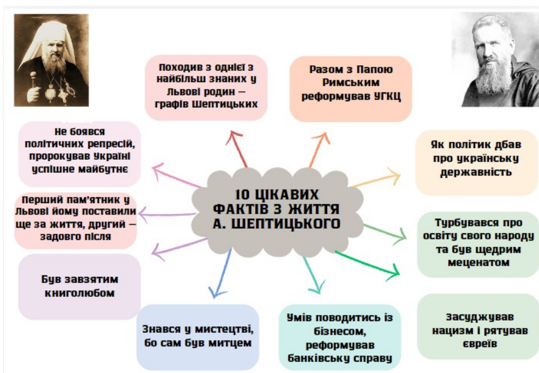
Рис. 3.1. Зразок інтеллектуальної карти «10 цікавих фактів із життя митрополита А. Шептицького»

Насамперед вважаємо, що в шкільний курс, зокрема при проведенні позакласних заходів, необхідно включити більше біографічних відомостей про А. Шептицького. Учням потрібно знати більше про дитинство митрополита, його оточення, освіту та життя. Слід наголосити учням про гуманізм А. Шептицького як про стрижень його душпастирської діяльності та сутність людини, а також варто особливу увагу звернути на те, яким чином та під впливом яких особистостей формувався внутрішній світ молодого чоловіка. Зокрема, рекомендуємо запропонувати учням рубрику «10 цікавих фактів із життя митрополита Андрея Шептицького». У межах цієї рубрики можна використати мультимедійну презентацію, інтелектуальну карту, плакат тощо, адже ці засоби допоможуть учням візуалізувати навчальний матеріал та краще запам'ятати відомості із життя митрополита. Наведемо зразок інтелектуальної карти «10 цікавих фактів із життя митрополита Андрея Шептицького» (рис. 3.1).