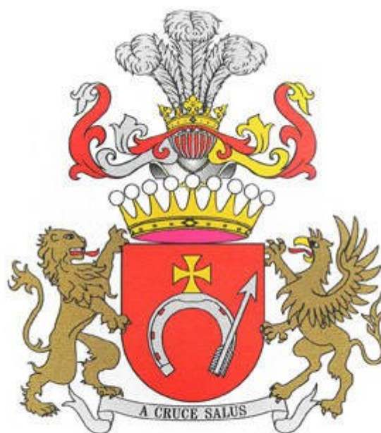
SZEPTYCKI hrabia, Austria, 1871 (Siebmacher, Leitgeber)