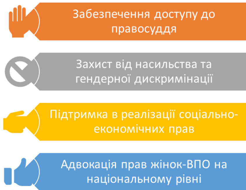
Рисунок 1.3 Основні напрямки роботи з правової допомоги

переселення. Основні напрямки роботи з правової допомоги окреслені на рисунку 1.3.