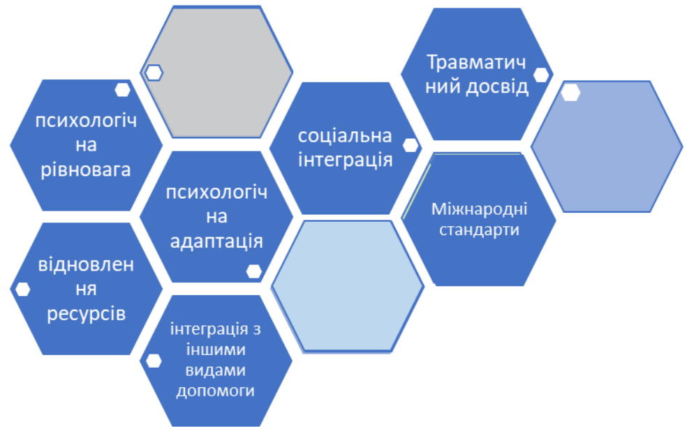
Рисунок 1.2 Напрямки роботи з психосоціальної підтримки жінок-переселенок.

Психосоціальна підтримка є однією з ключових складових соціальної роботи з жінками-внутрішньо переміщеними особами, оскільки вона спрямована на подолання комплексних психологічних та соціальних проблем, що виникають унаслідок конфліктів, переселення та інших кризових ситуацій. Внутрішнє переміщення часто супроводжується високим рівнем стресу, втратами, порушенням соціальних зв'язків, що негативно впливає на психоемоційний стан жінок та їхню здатність адаптуватися до нових умов життя.