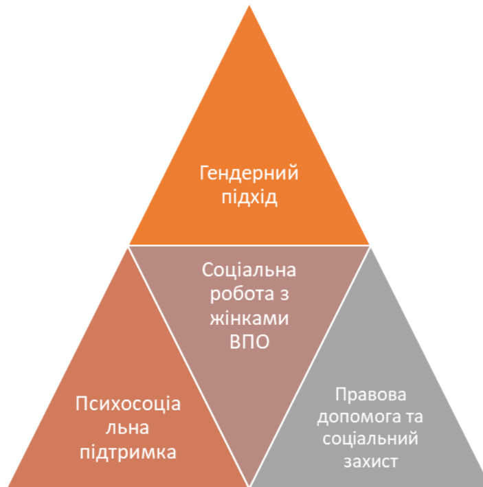
Рисунок 1.1 Складові соціальної роботи з жінками-переселенками.

глибокого аналізу з обов'язковим урахуванням гендерної нерівності, соціальних стереотипів та економічної уразливості.