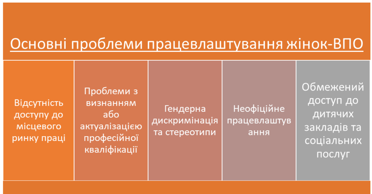
Рисунок 1.5 Основні проблеми працевлаштування жінок-ВПО

Соціальний захист у сфері зайнятості має передбачати програми професійної перепідготовки та підвищення кваліфікації для жінок-ВПО, які дозволять їм здобути нові навички та адаптуватися до вимог ринку праці. Також важливо розробляти програми, що сприяють працевлаштуванню переселенців, включаючи заходи для заохочення роботодавців наймати ВПО, створення умов для гнучкого графіка роботи та дистанційної зайнятості, що дозволяє жінкам поєднувати роботу з доглядом за дітьми.