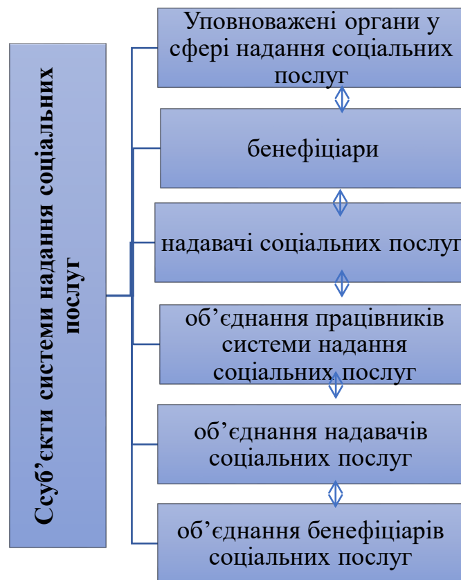
Рис.1.1. Суб'єкти надання соціальних послуг

З урахуванням положень статті 8 Закону України "Про соціальні послуги" [8] учасники системи соціальних послуг можна представити за допомогою наведеної нижче схеми (див.рис.1.1)