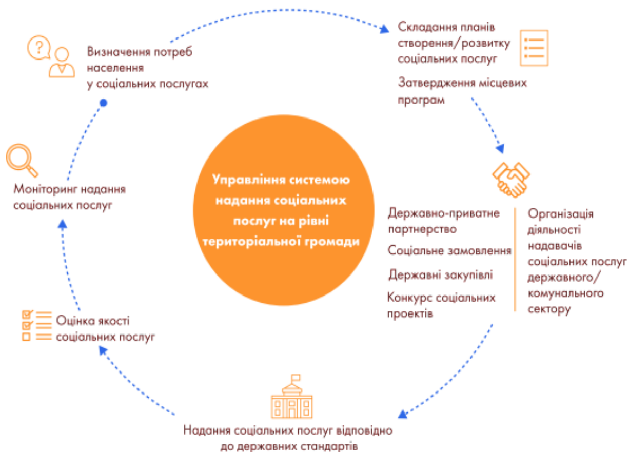
Рис. 1.3. Повноваження територіальних громад щодо розвитку системи надання соціальних послуг

Повноваження територіальних громад у наданні соціальних послуг населенню зображено на рис.1.3. [36].