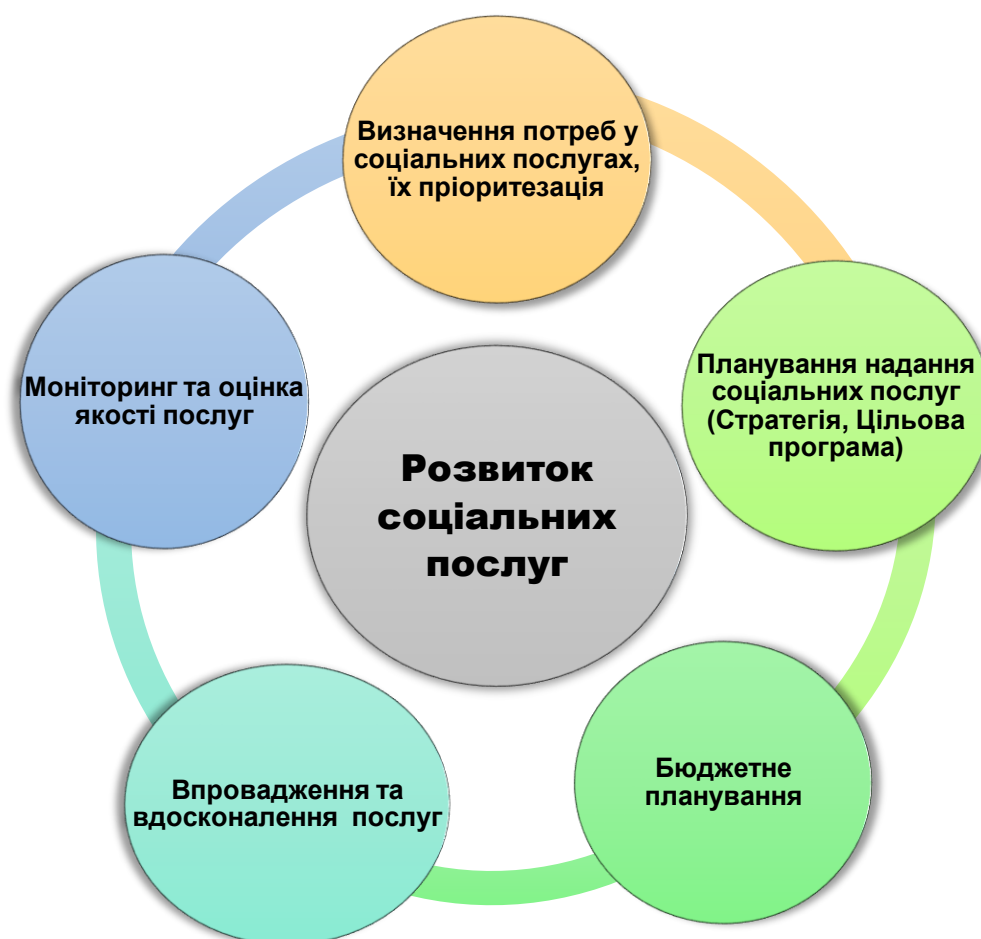
Рис. 2.1. Регламент організації та надання соціальних послуг у територіальній громаді

Відповідно до пункту 4 частини 4 статті 11 Закону України, територіальним громадам надано право забезпечення надання основних соціальних послуг. Це означає, що громади тепер не лише несуть відповідальності за соціальне забезпечення, але й зобов'язані дотримуватися державних стандартів, затверджених Міністерством соціальної політики України. Державні стандарти, в свою чергу, доступність якості та доступність соціальних послуг, що надаються.