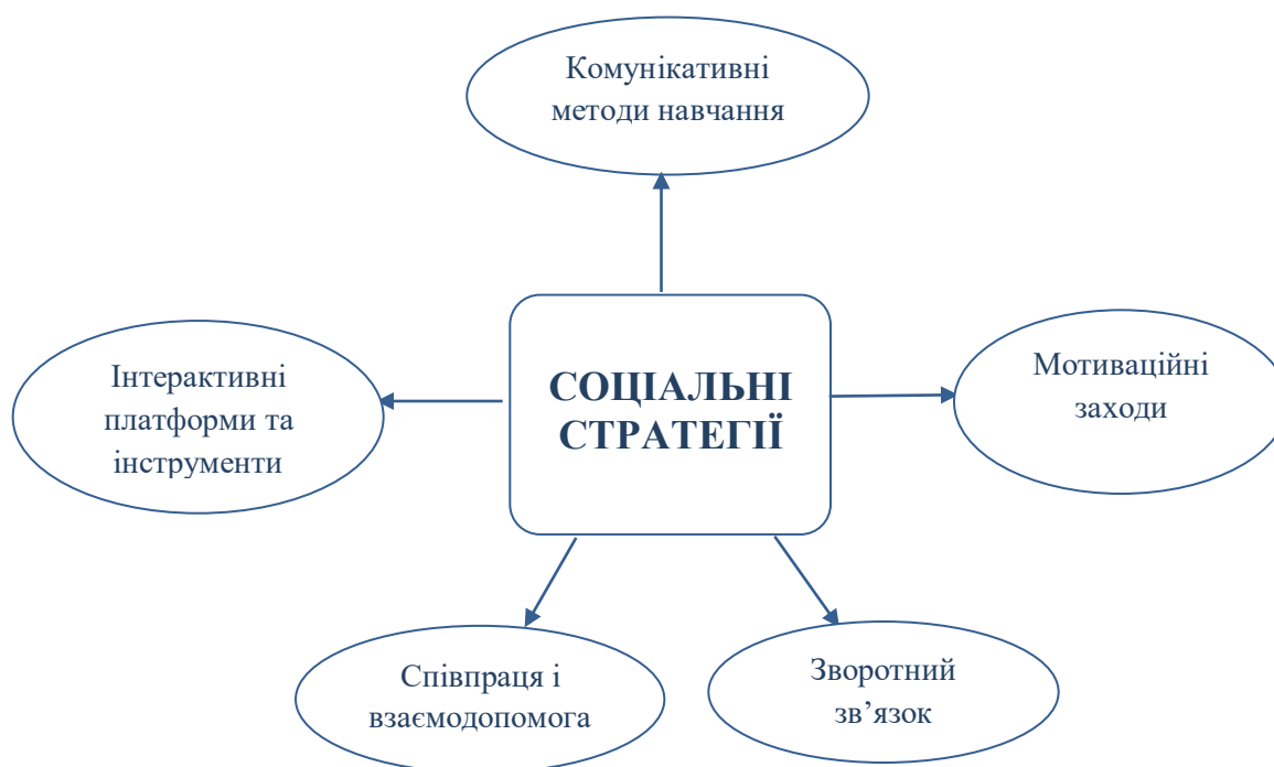
Рисунок 2.2 Соціальні стратегії для підвищення мотивації студентів

Підсумовуючи, зазначаємо, що основними аспектами соціальних стратегій, спрямованих на підвищення мотивації здобувачів вищої освіти до навчання іноземних мов у дистанційному форматі, є такі (рис. 2.2.):