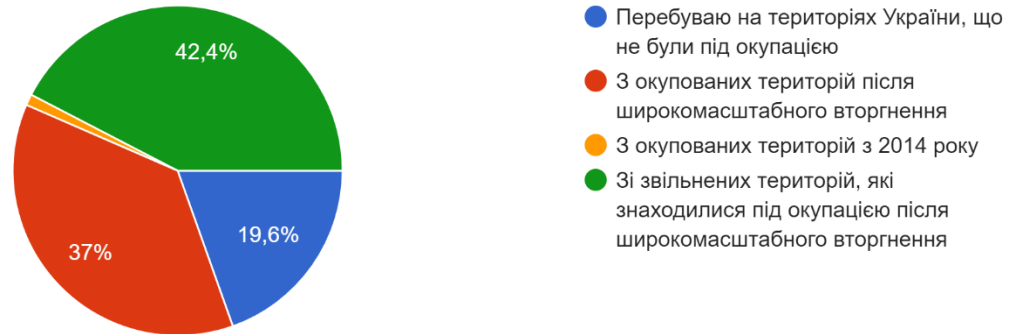
Рис. 2.1. Географія учасників дослідження

Варто зазначити, що для зручності проведення дослідження, усі опитувальники були поміщені у Google-форму, яка мала також титульний аркуш та детальні інструкції перед кожною з методик. Анкета є анонімною і без зазначення назв самих методик.