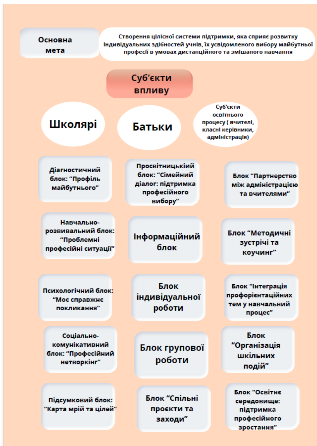
Рисунк 2.1 Модель психолого-педагогічного супроводу

Відповідно до моделі виокремлюється три суб'єкти впливу: школярі, батьки та педагогічний колектив. Робота із кожною групою впливу