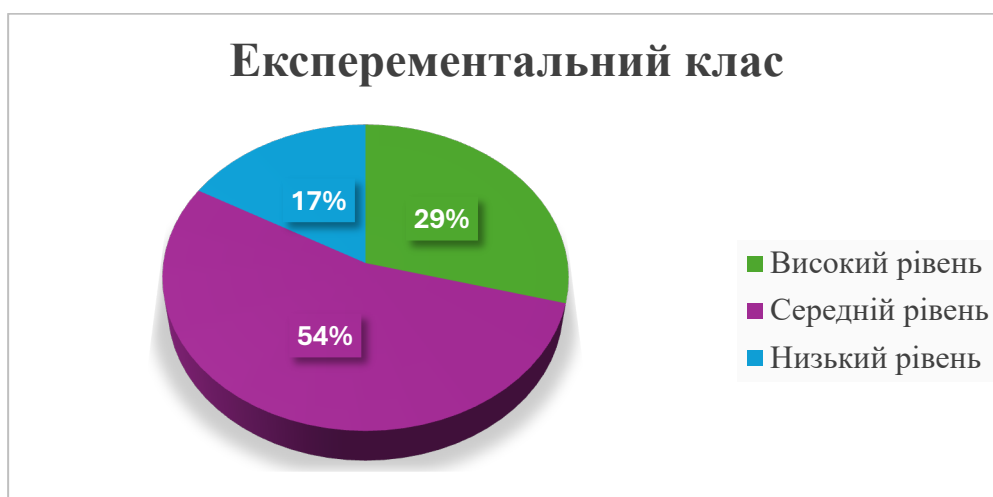
Рис. 2.5. Рівні сформованості цінності особистості іншої людини в учнів експериментального класу на контрольному етапі дослідження

Рівні сформованості цінності особистості іншої людини в учнів експериментального класу на контрольному етапі дослідження, рис 2.5.