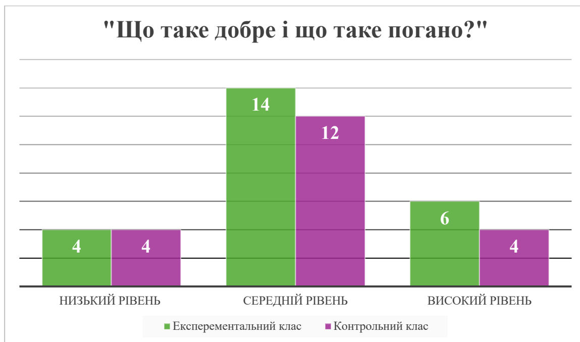
Рис. 2.3. Результати дослідження в експериментальному та контрольному класах за методикою «Що таке добре і що таке погано»