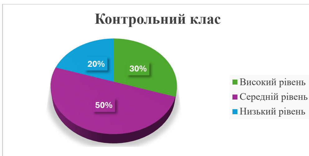
Рис. 2.6. Рівні сформованості цінності особистості іншої людини в учнів контрольного класу на контрольному етапі дослідження

Рівні сформованості цінності особистості іншої людини в учнів контрольного класу на контрольному етапі дослідження, рис.2.6.