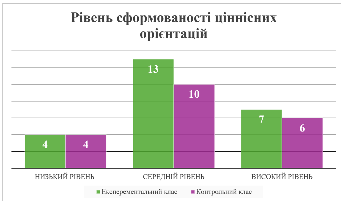
Рис. 2.7. Розподіл учнів за рівнями сформованості цінності особистості іншої людини під час проведення контрольного етапу експерименту

За допомогою таблиці 2.7. По завершенні роботи, порівняємо результати констатувального етапу експерименту з результатами контрольного зрізу в експериментальному і контрольному класах.