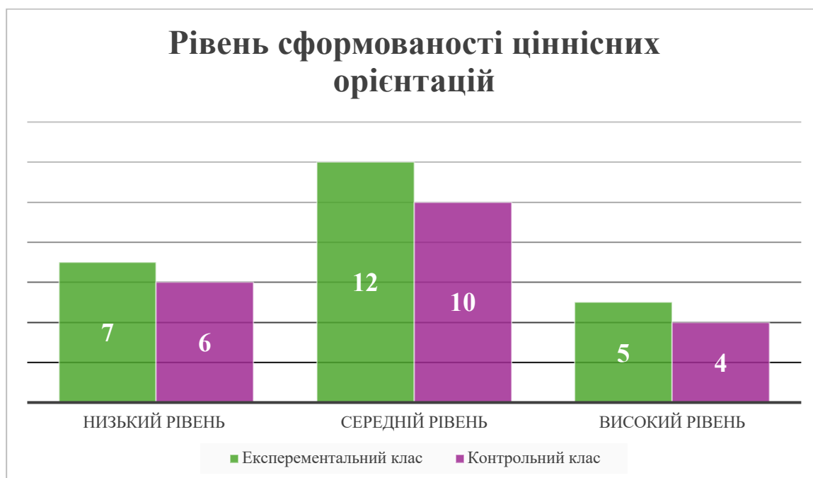
Рис. 2.4. Розподіл молодших школярів за рівнями сформованості цінності особистості іншої людини під час проведення констатувального етапу дослідження

Розподіл за рівнями сформованості цінності особистості іншої людини в молодших школярів під час проведення констатувального етапу дослідження, рис 2.4