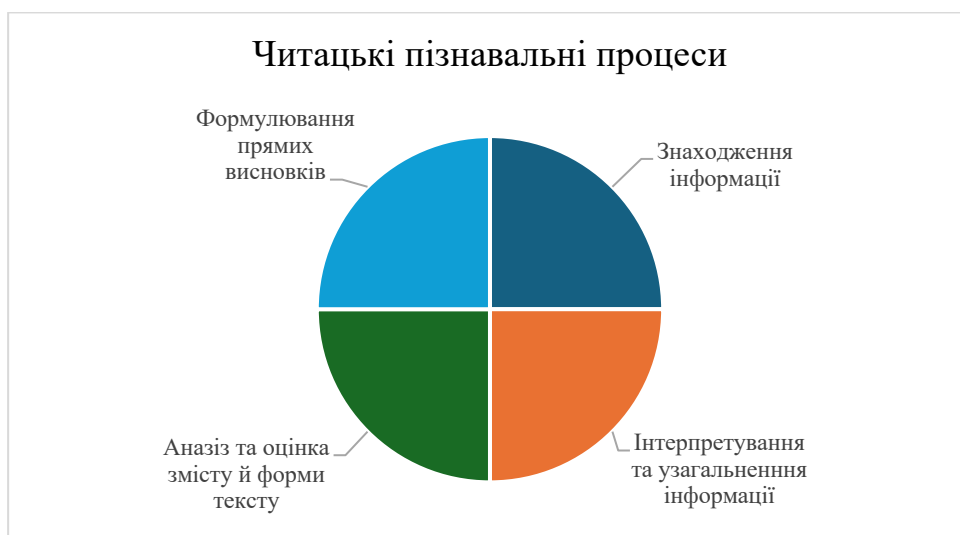
Рис.1.2. Читацькі пізнавальні процеси.

Основний зміст завдань із вимірювання читацької компетентності структуровано за такими читацькими пізнавальними процесами вказаними на рисунку 1.2: знаходження інформації; формулювання прямих висновків; інтерпретування й узагальнення (інтегрування) інформації; аналізування та оцінювання змісту й форми тексту.