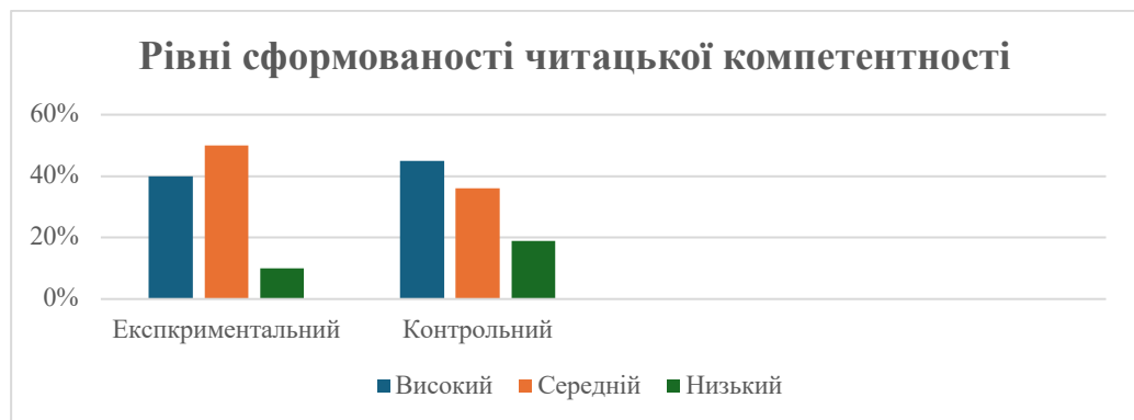
Рис.2.1. Рівні сформованості читацької компетентності на констатувальному етапі

контрольній групі цей показник склав 45% (5 учнів). Середній рівень: В експериментальній групі 5 учнів, що склало 50% , продемонстрували середній рівень сформованості читацьких умінь, а в контрольній групі – 36% (4 особи). Низький рівень: на низькому рівні сформованості читацької компетентності в експериментальній групі опинився 1 учень, що склало 10%, в контрольній групі – 2 учня, що склало 19% . Ці результати відображені на рисунку 2.1.