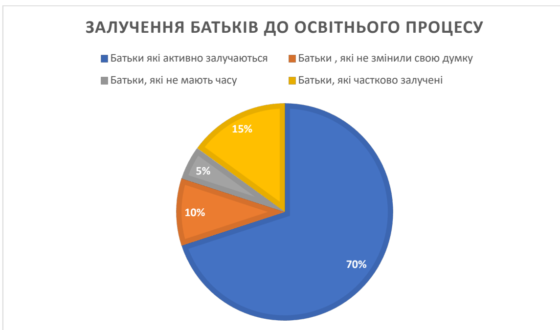
Рисунок 4. Залучення батьків до освітнього процесу