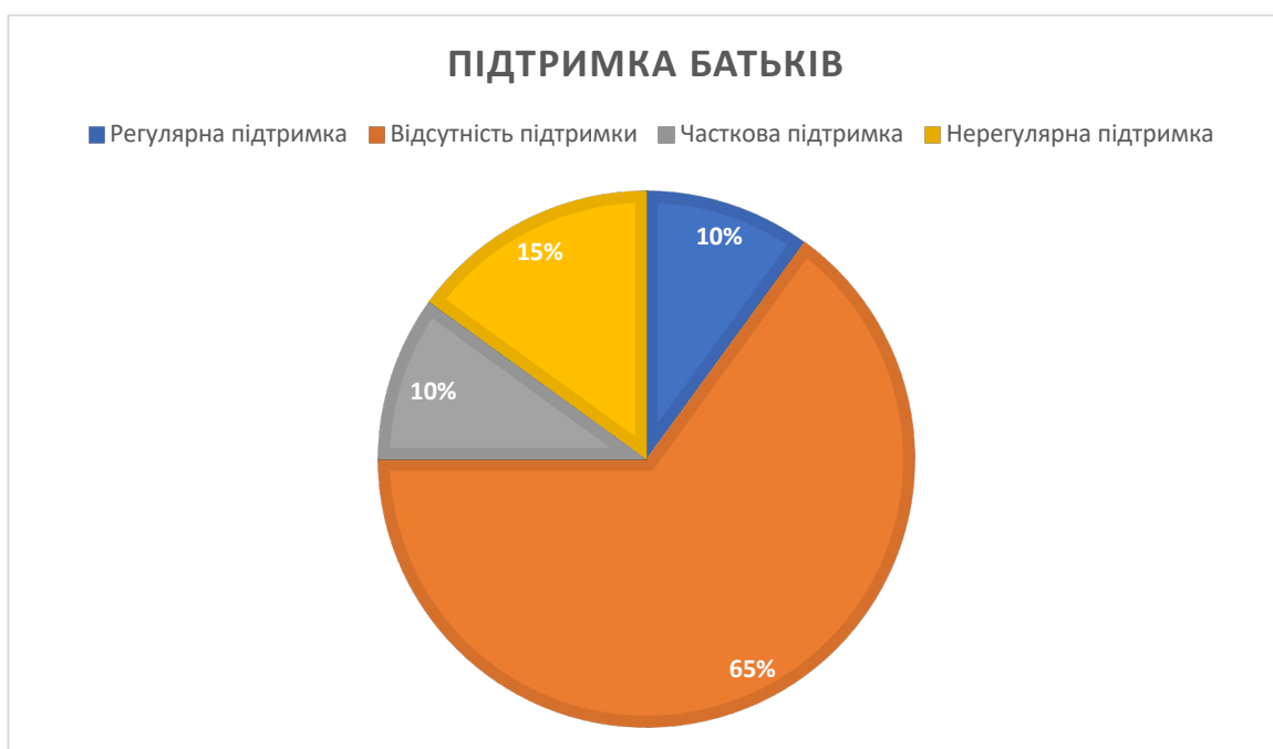
Рисунок 2. Підтримка батьків у навчанні дітей природничих дисциплін

На формульовальному етапі дослідження було впроваджено ряд заходів, спрямованих на посилення партнерських відносин між школою та батьками у дистанційній формі навчання природничої освітньої галузі.