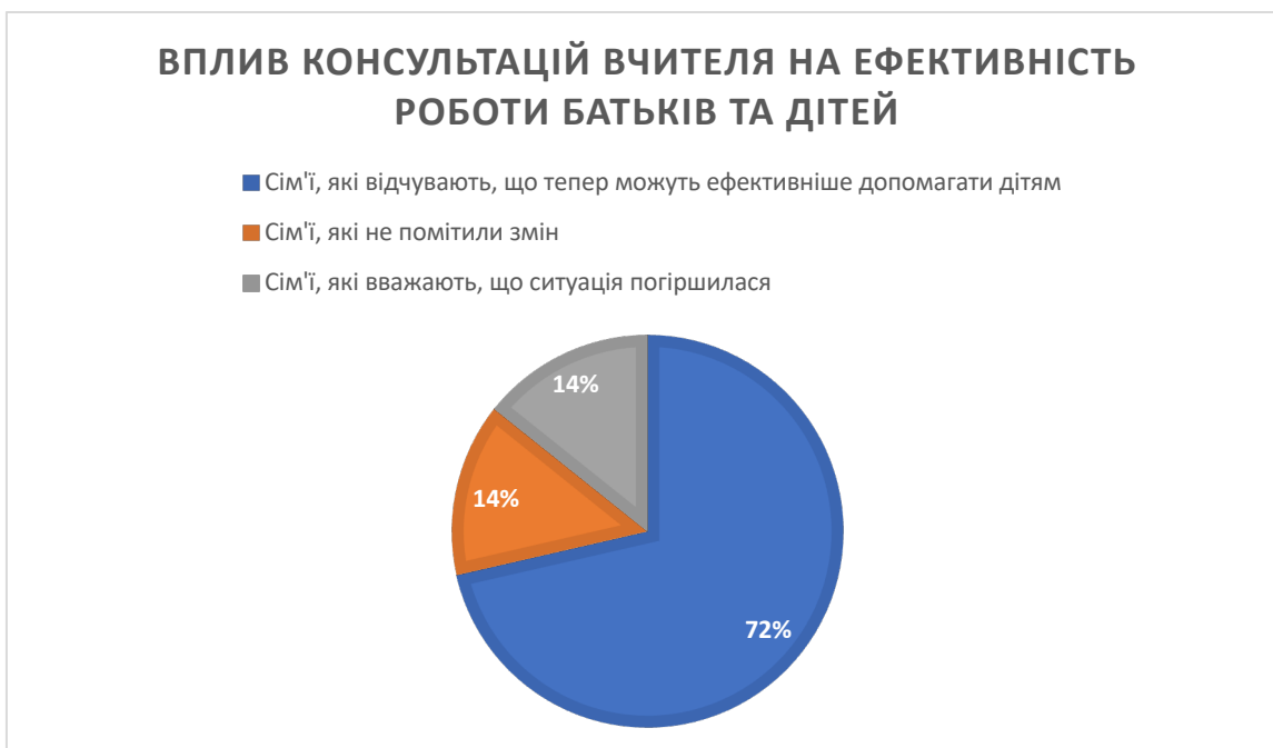
Рисунок 5. Вплив консультацій вчителя на ефективність роботи батьків та дітей