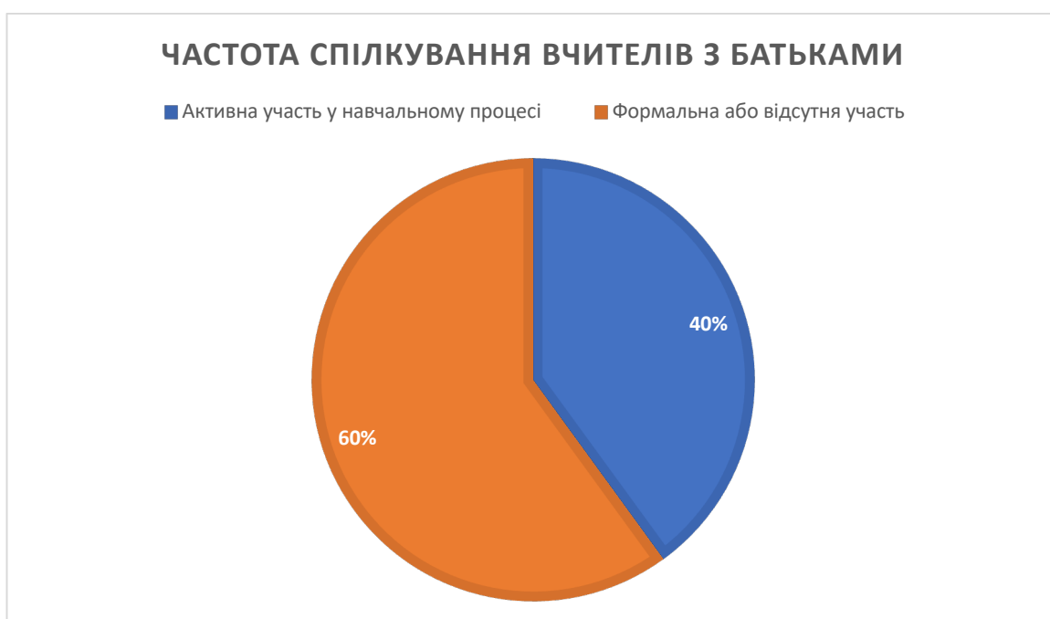
Рисунок 1. Частота спілкування батьків з учителями

На констатувальному етапі проведено первинне опитування серед здобувачів, батьків та вчителів обох категорій. Метою цього етапу було визначити рівень початкової залученості батьків до освітнього процесу, а також оцінити наявний рівень довіри між батьками та вчителями. За результатами, як показано на Рисунку 1, що лише близько 40% батьків активно спілкувалися з учителями та брали участь у навчальному процесі дітей. Решта 60% або взагалі не взаємодіяли з педагогами, або ж їхня участь мала формальний характер.