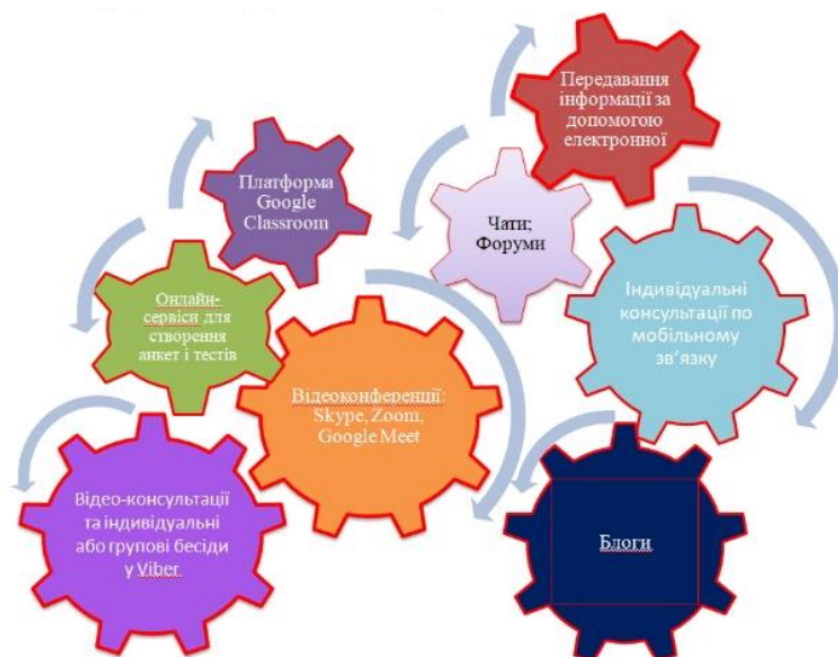
Рис.1.4. Форми взаємодії учасників освітнього процесу під час дистанційного навчання

З метою удосконалення дистанційного навчання в нашій країні це питання розглянуто ще починаючи з 2005 р. на Колегії Міністерства освіти України (Протокол № 6/2-4 від 23 червня 2005 р.). У положеннях Колегії акцентовано важливість розвитку дистанційного навчання, яке розширює можливості доступності для усіх соціальних категорій суспільства та підвищує рівень конкурентоздатність освіти, створює умови для поліпшення розвитку різних сфер діяльності суспільства. Для забезпечення дистанційного навчання в Україні створено Український інститут інформаційних технологій в освіті Національного технічного університету України «Київський політехнічний інститут», створено систему регіональних центрів дистанційного навчання.