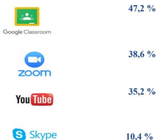
Рис.1.5. Найпопулярніші інструменти та платформи для дистанційного навчання