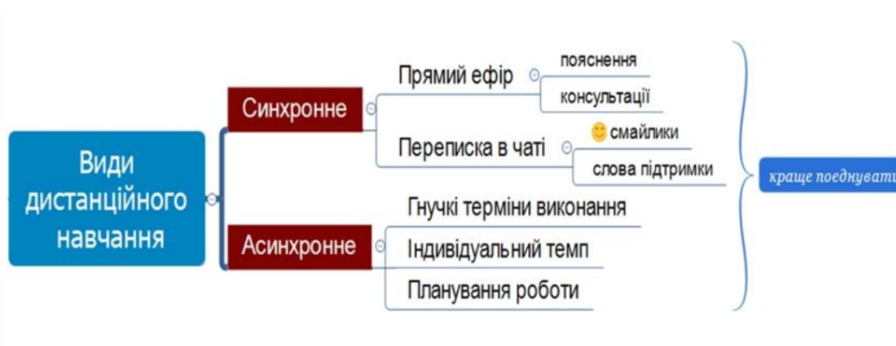
Рис.1.2. Види дистанційного навчання

Науковці також виділяють певні моделі дистанційного навчання, узагальнена інформація представлена на рис.1.3.