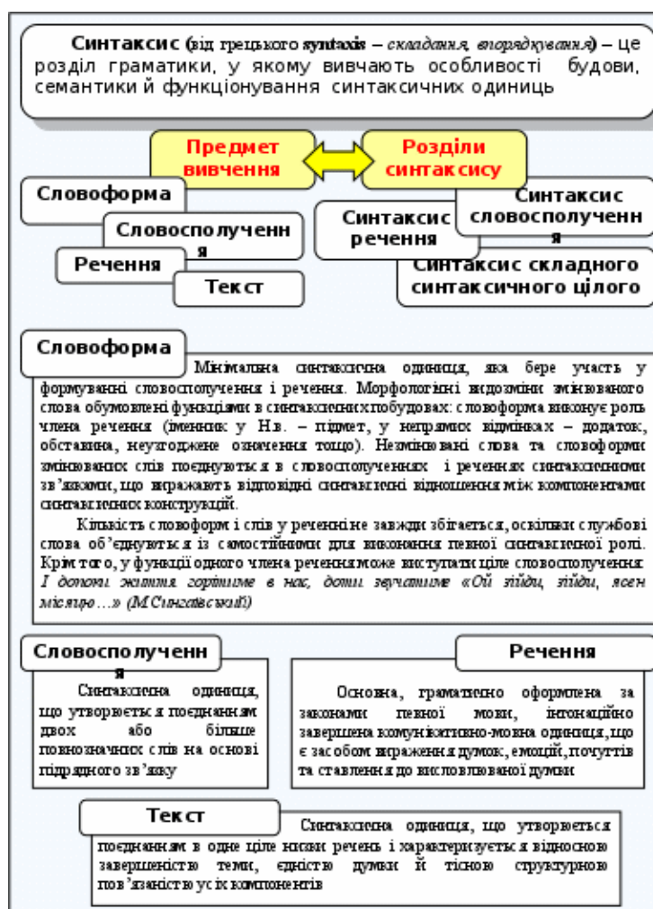
Рис.1.1. Характеристика понять синтаксису як розділу мовознавства