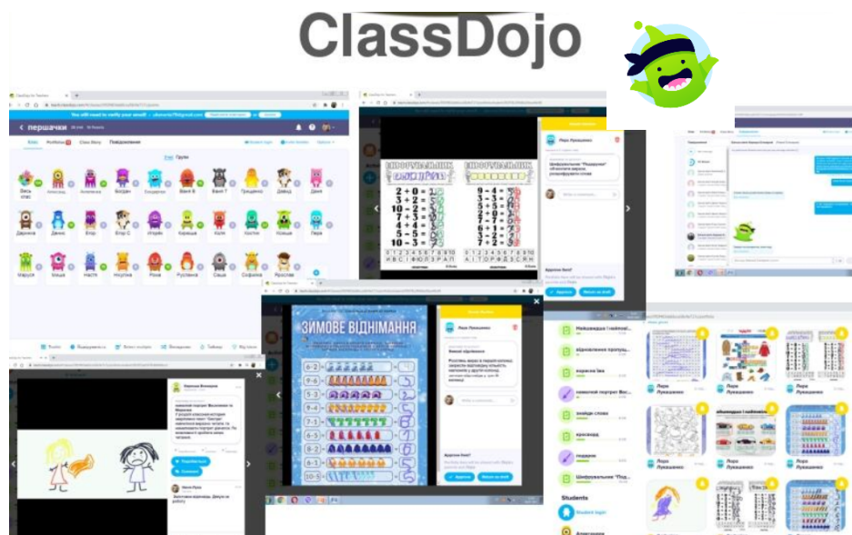
Рис.1.6. Приклад використання цієї платформи зі здобувачами початкової освіти

Також вчителі початкових класів широко використовують цікаву, яскраву та інтерактивну освітню платформу https://www.classdojo.com/uk-ua/ . Візуально представимо приклад використання цієї платформи зі здобувачами початкової освіти на рис.1.6.