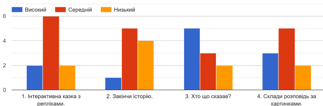
Початковий рівень сформованості мовлення дітей дошкільного віку

основні події, часто повторює слова педагога або взагалі не формулює відповідей; 4 дітей (40%) - не може продовжити або закінчити історію, потребують значної допомоги, їх розповідь непослідовна або обмежується декількома словами чи жестами; 2 дітей (20%) - не розпізнає, хто що сказав, або потребує значної допомоги, їх відповіді дуже короткі та не завжди змістовні; 2 дітей (20%) - не може послідовно описати картинку, вказує на окремі деталі без зв'язку між ними або відповідає дуже коротко. У діаграма 2.1. подано результати визначення початкового рівня сформованості мовлення дітей дошкільного віку.