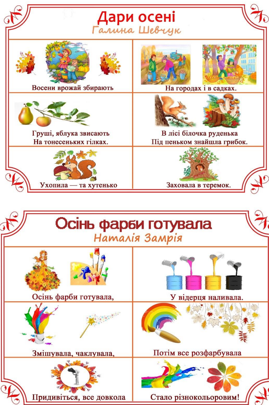
Рис.1.2. Приклади схем-моделей до блоку «Осінь»

Також для дошкільників ефективним є використання чорно-білих мнемотаблиць для розвитку творчості та варіацій побудови розповідей.