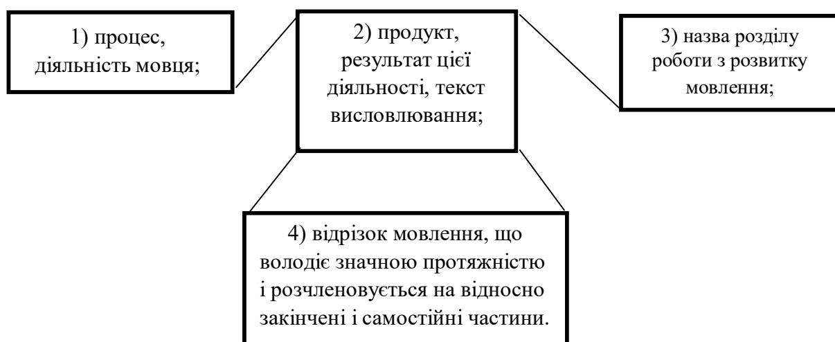
Рис. 1.1 – Варіанти дефініції мовлення у науковій літературі

Дефініція «мовлення» у науковій літературі використовується в кількох значеннях, які графічно представлені у рис. 1.1.