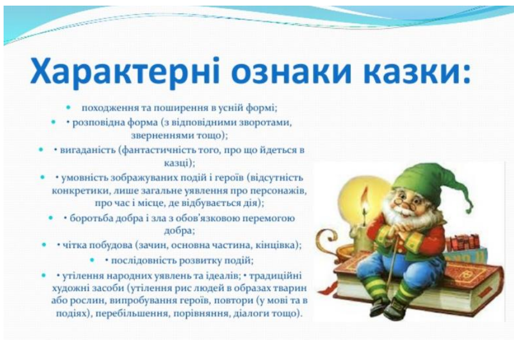
Рис.1.4. Характерні ознаки казки

Характерні ознаки казки представимо у рис.1.4.