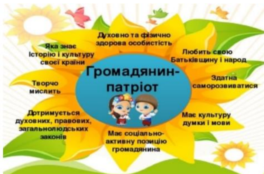
Рис.1.2. Загальна характеристика громадянина-патріота для дошкільників

Відповідно до аналізу особливостей формування патріотичних почуттів здобувачів дошкільної освіти можемо сформулювати загальну характеристику громадянина-патріота для дошкільників, що представлена у рис.1.2.