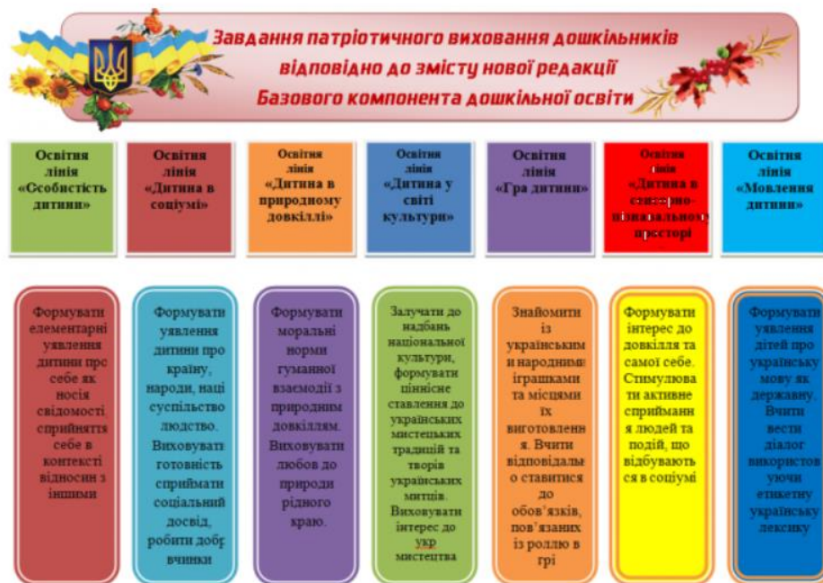
Рис.1.1. Завдання патріотичного виховання відповідно до змісту Базового компоненту дошкільної освіти

Базовий компонент дошкільної освіти характеризує завдання патріотичного виховання, представимо коротку структури у рис.1.1.