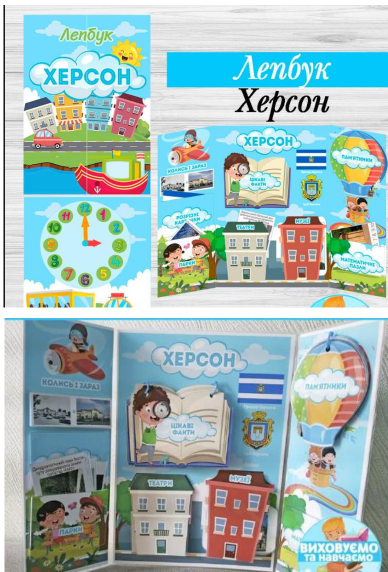
Рис.2.1. Приклад лепбуку «Херсон»

З метою зацікавлення дітей до історії рідного краю нами було запропоновано ознайомитись з відеоматеріалами про історію та культурні пам'ятки Херсонщини та запропонували батькам з дітьми створити лепбук «Мій Херсон». Приклад такого лепбуку для батьків та дітей дошкільного віку представлено у рис.2.1.