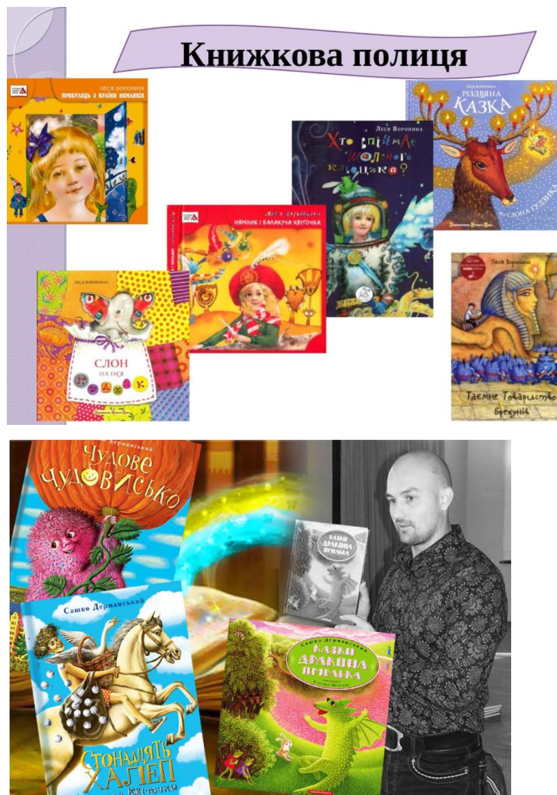
Рис.2.4. Приклад портфолію з сучасними українськими творами

Отже, у результаті цілеспрямованої роботи у експериментальній групі діти розширили свої знання про історію свого краю, дитячих авторів рідного краю, познайомились з сучасної української літературою. Звернення до фольклору, прослуховування українських народних казок, відгадування загадок, співи народних пісень викликали зацікавленість до пізнання історичної спадщини, культури своєї країни, рідного краю.