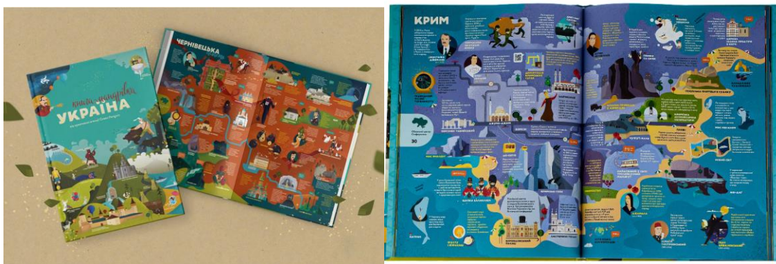
Рис.2.2. Приклади матеріалів книг проєкту «Книга-мандрівка. Україна»

Тематика відео для дітей з ознайомлення з сучасними та історичними важливими подіями, відомими українцями за проєктом «Книга-мандрівка. Україна» продемонстровано у рис.2.3.