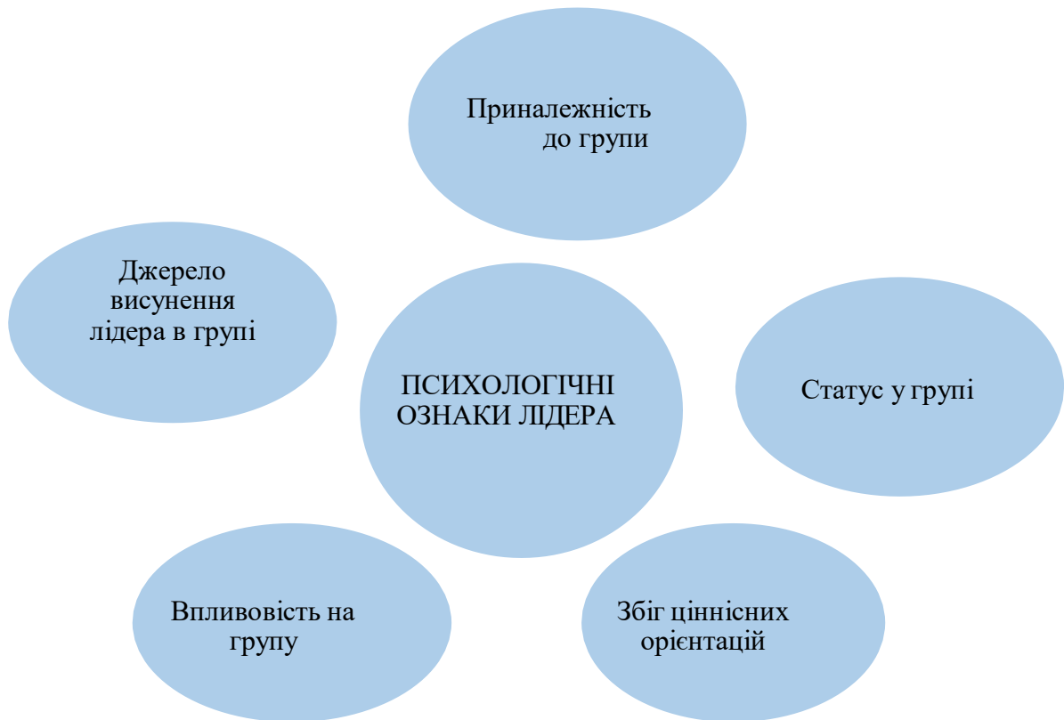
Рис. 1.1. Основні ознаки лідера з психологічної точки зору