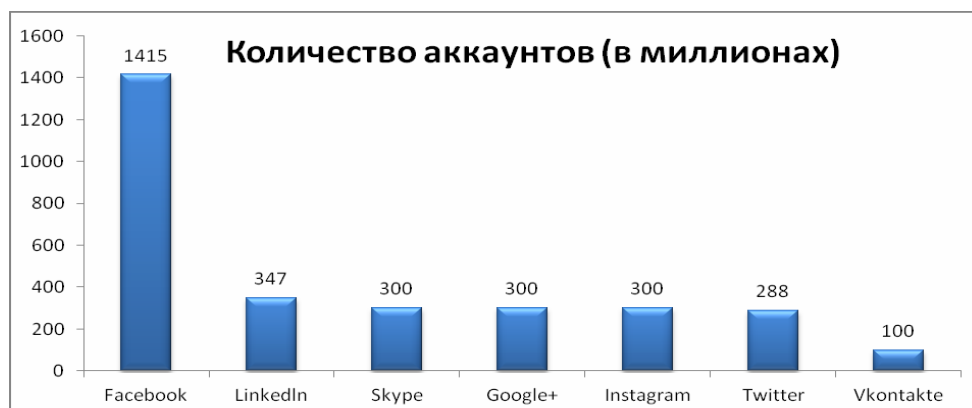
Рис. 1. Количество активных аккаунтов социальных сетей (в миллионах)

Количество активных аккаунтов пользователей социальных сетей по данным сайта www.statista.com на март 2015 года показано на рис.1 [40].