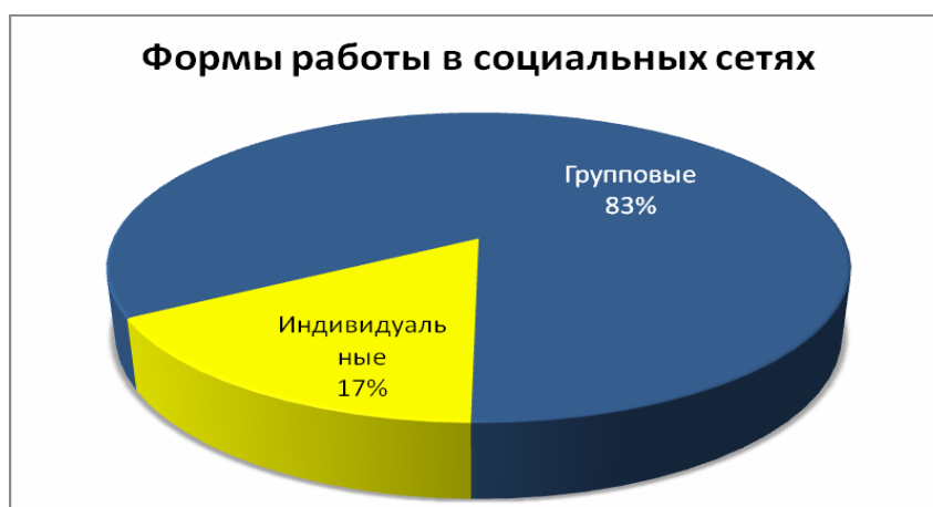
Рис. 3. Выбор студентами форм работы в социальных сетях

Проведенный опрос показал, что все студенты используют социальные сети для общения в личных целях, из них более половины опрошенных пользуются социальными сервисами для обучения и научной деятельности. При этом уже на первом курсе примерно 20 % студентов применяют социальные сети в целях, связанных с будущей профессиональной деятельностью.