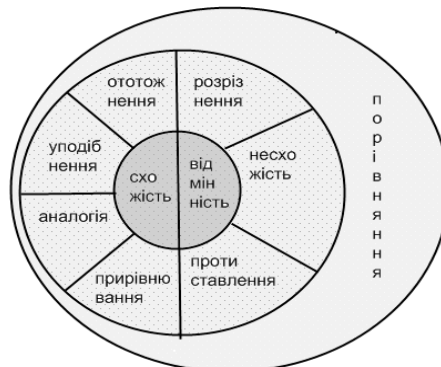
Рис. 2. Категоріальний простір когнітивної операції порівняння

Отже, дуалістичні взаємовідношення схожості/відмінності становлять ядро категорії порівняння [15: 79]. У той час, як ототожнення, прирівнювання, аналогія, уподібнення, несхожість, розрізнення, протиставлення набувають периферійного статусу (див. рис. 2).