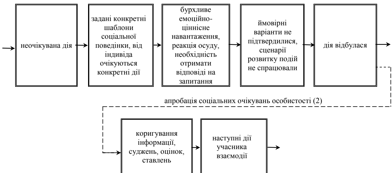
Рис. 2. Психологічний механізм неочікуваної дії міжособистісної взаємодії за умови заданих конкретних шаблонів соціальної поведінки

На рис. 2 схематично покажемо наступний психологічний механізм неочікуваної дії в міжособистісній взаємодії, коли відсутній інформаційний дефіцит і є стандартизовані шаблони соціальної поведінки, та простежується ймовірний розвиток подій.