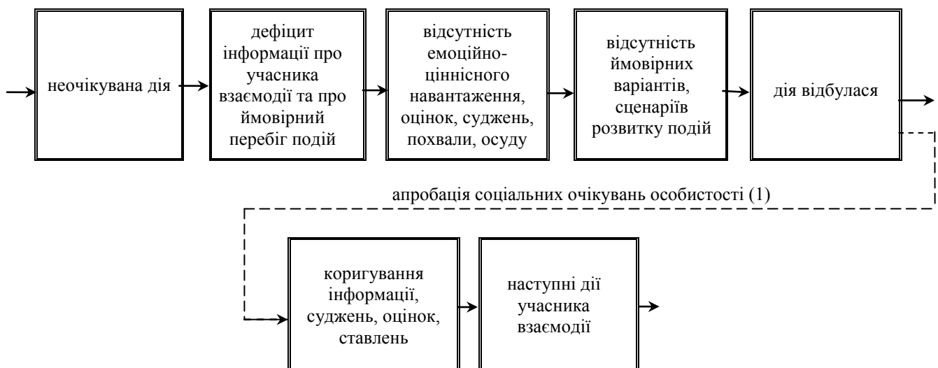
Рис. 1. Психологічний механізм неочікуваної дії міжособистісної взаємодії за умови інформаційного дефіциту про учасника взаємодії

інформації про неї, перебіг подій, у якому відбувається неочікувана дія. Інформаційний дефіцит позначається на оцінках, оцінних ставленнях оточуючих до особистості і зазвичай супроводжується відсутністю емоційно-ціннісного навантаження. Останнє виключає ймовірні варіанти чи сценарії розвитку подій, які можуть народитися в його уяві, тому для оточуючих дії такого учасника взаємодії є неочікуваними. Звичайно, за змістом, дії та вчинки можуть бути як позитивні, так і негативні. Це один з варіантів розвитку подій, коли дії індивіда неочікувані. Можливий інший варіант, коли задані шаблони соціальної поведінки, – від індивіда очікують зрозумілих і конкретних дій, а він чинить непередбачувано. Звісно, якщо інформаційного дефіциту немає, тоді оцінка дій, оцінні ставлення оточуючих супроводжуються, як правило, бурхливим емоційно-ціннісним навантаженням, має місце реакція осуду, зазвичай спрацьовують групові санкції. Оточуючі прагнуть отримати відповідь на низку запитань: «Чому так вчинено? З чим пов'язана така поведінка? Що спонукало?» Покажемо схематично на рис. 1 психологічний механізм неочікуваної дії в міжособистісній взаємодії, за умови інформаційного дефіциту.