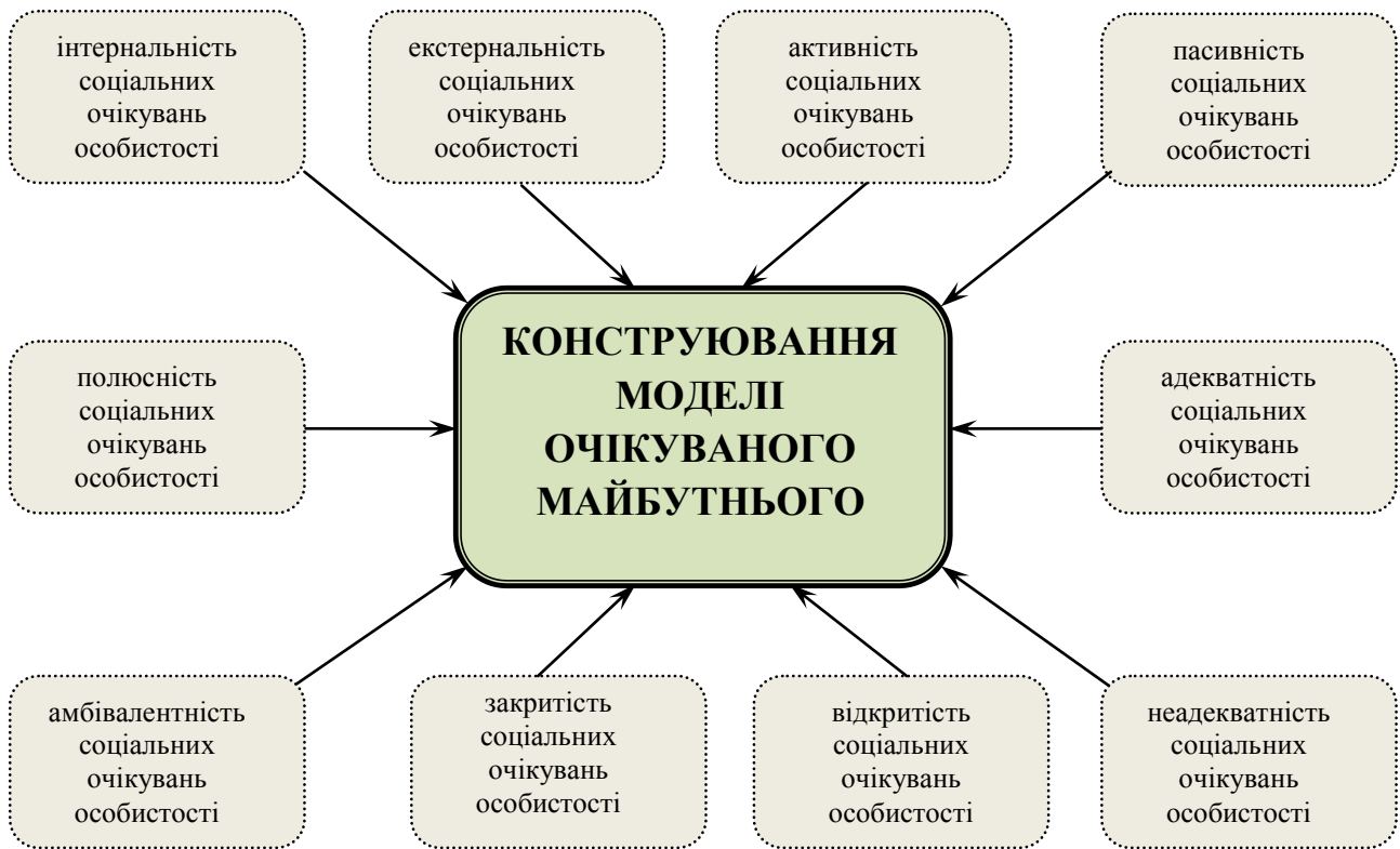
Рис. 4. Залежність конструювання моделі очікуваного майбутнього від властивостей соціальних очікувань особистості

ідентичних ситуаціях її соціальні очікування наділені екстернальним змістом. Протилежною амбівалентності вважаємо полюсність. Крайні значення дихотомічної пари будуть свідчити тільки про сформованість цієї властивості. Може мати місце будь-яка комбінація дихотомічних пар властивостей.