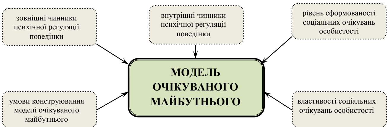
Рис. 6. Конструювання моделі очікуваного майбутнього

Розглянувши залежність конструювання моделі очікуваного майбутнього від зовнішніх чинників психічної регуляції поведінки (див. рис. 1), від внутрішніх чинників психічної регуляції поведінки (див. рис. 2), від рівнів сформованості соціальних очікувань особистості (див. рис. 3) та властивостей соціальних очікувань особистості (див. рис. 4), у логічній послідовності проаналізувавши умови конструювання моделі очікуваного майбутнього (див. рис. 5), можемо запропонувати схему конструювання моделі очікуваного майбутнього (рис. 6) як неієрархічний, нелінійний зв'язок п'яти складових.