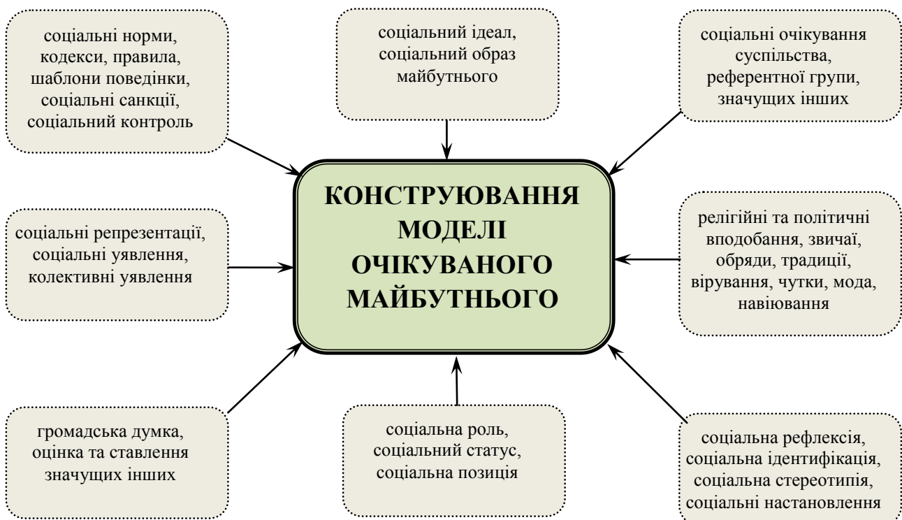
Рис. 1. Залежність конструювання моделі очікуваного майбутнього від зовнішніх чинників психічної регуляції поведінки

Зауважимо, що «будівельний матеріал» для конструювання моделі очікуваного майбутнього особистість черпає не тільки з внутрішнього джерела соціальних очікувань особистості – її Я-концепції, а й з зовнішніх джерел – домінуючих соціальних репрезентацій (С.Московічі), соціальних уявлень (Т.П.Ємельянова, І.В.Жадан) і навіть з колективних уявлень (Е.Дюркгейм).