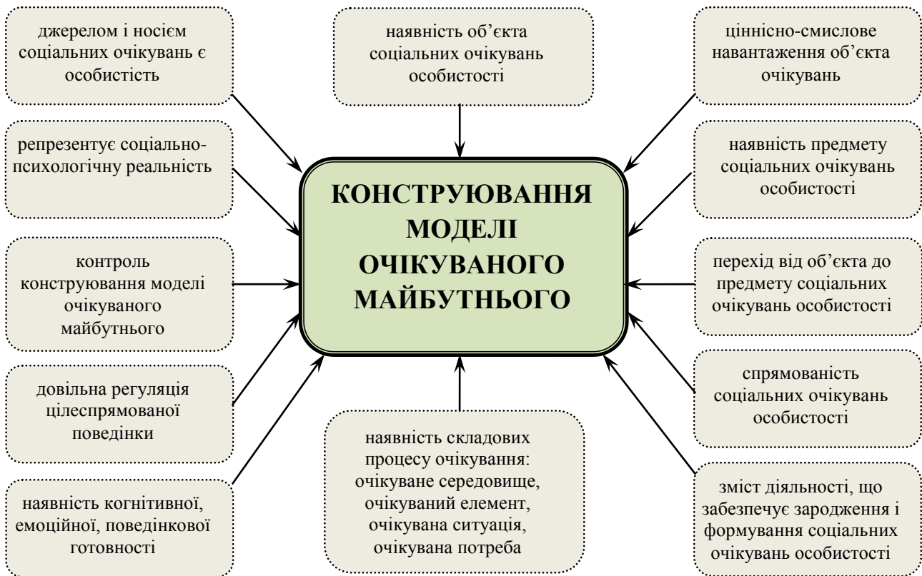
Рис. 5. Умови конструювання моделі очікуваного майбутнього

Наш алгоритм конструювання моделі очікуваного майбутнього буде неповним, якщо не врахувати умови, за яких, власне, може реалізуватися процес конструювання (рис. 5).