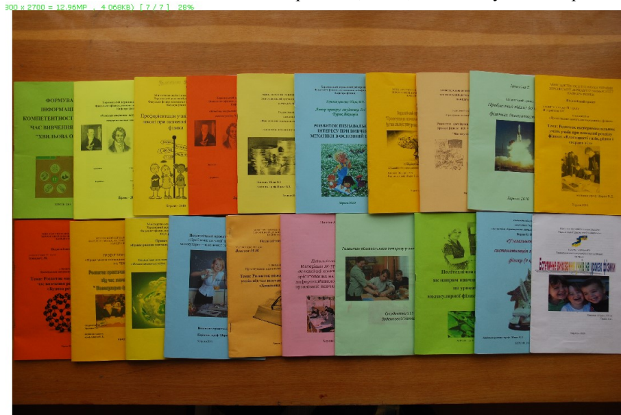
Рис.1. Студентські проекти.

Середовище «Студентські проекти» містить зріз робіт студентів попередніх курсів (рис.1), які для тих, хто вивчає дисципліну, слугують прикладами таких, які можна вважати кращими, і такі, які наслідувати не треба.