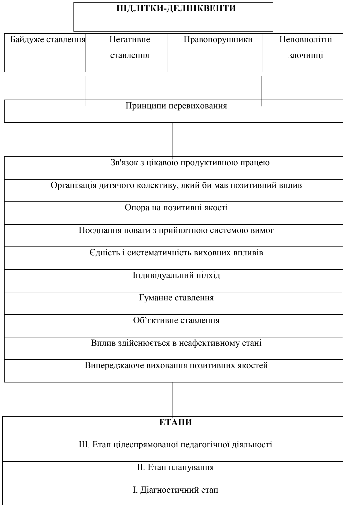
Рис.2.1. Напрямки та етапи перевиховання підлітків-делінквентів