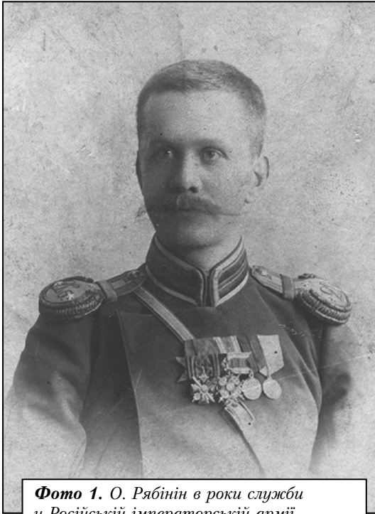
Фото 1. О. Рябінін в роки служби у Російській імператорській армії

Олександр Рябінін-Скляревський (1878-1942 рр.) – уродженець м. Солігалич Костромської губернії, кадровий офіцер Російської імператорської армії (див. фото 1 [8]), учасник Російсько-японської (1904-1905 рр.) та Першої світової (1914-1918 рр.) воєн, талановитий військовий, учений і публіцист. У відставці, впродовж 1923-1937 років, він реалізувався як відомий український історик, позаштатний співробітник Всеукраїнської Академії Наук, один з визначних дослідників історії козацтва в 20-ті роки ХХ століття. Репресований у 1937 році. Помер у засланні в 1942 році.