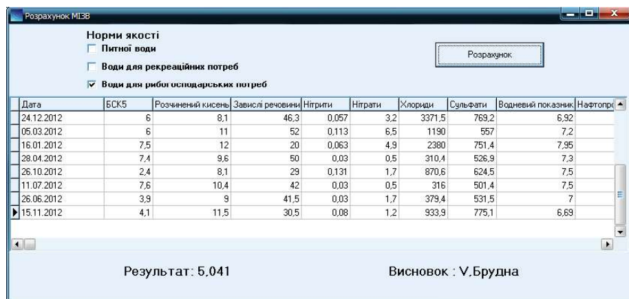
Рисунок 2. Програмна форма «Розрахунок модифікованого ІЗВ»